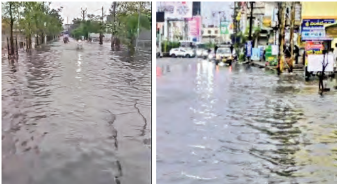
గురువారం భారీ వర్షానికి జలమయమైన కరీంనగర్ లోని రహదారులు

దేశంలోని సంపన్న ముఖ్యమంత్రులలో దక్షిణాది నేతలే టాప్ 3లో ఉన్నారు. వీరిలో కర్ణాటక సిఎం డి.కె. శివకుమార్ రూ. 1413 కోట్ల సంపదతో నం.1 స్థానంలో ఉన్నారు. రూ. 931 కోట్ల సంపదతో రెండో స్థానంలో ఎ.పి. సెలవం చంద్రబాబు. రూ. 648 కోట్ల సంపదతో తమిళ సిఎం విజయ్ టాప్ 3లో ఉన్నారు. ఈజిప్టులో రూ. 30 కోట్ల సంపదతో సిఎం రేవంత్ రెడ్డి 8వ స్థానంలో ఉన్నారు.