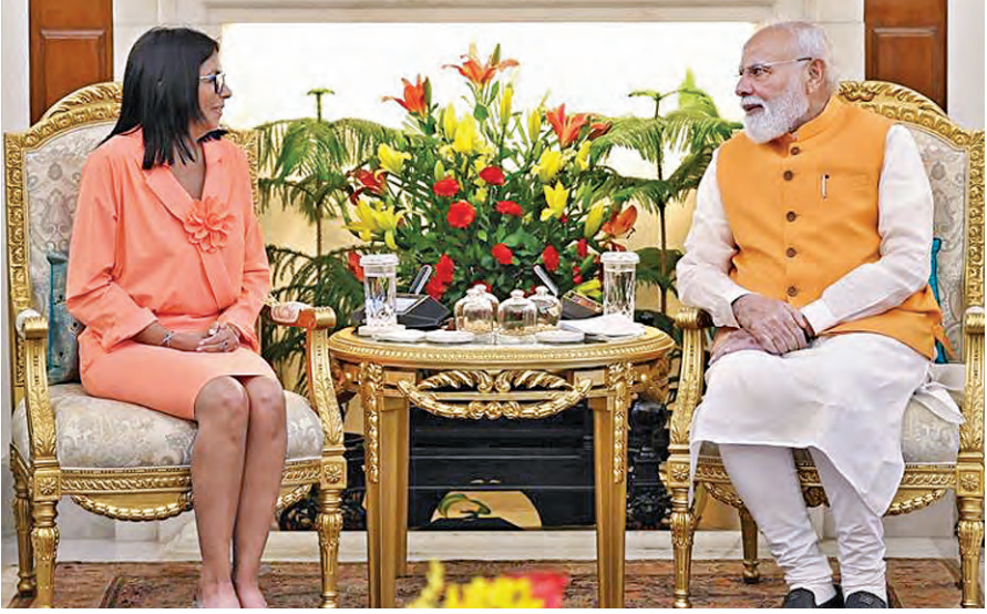
గురువారం న్యూఢిల్లీలో ప్రధాని మోడీతో భేటీ అయిన వెనిజలా తాత్యుల దెల్లి రోడ్డిన్