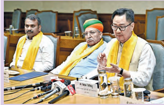
గురువారం న్యూఢిల్లీలోని పార్లమెంట్ భవనంలో మీడియాతో కేంద్ర మంత్రి కిరణ్ రిజిజా