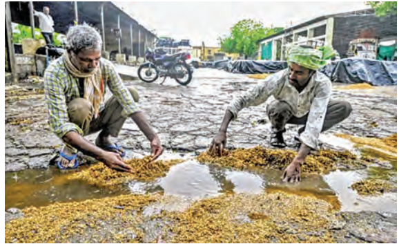
కరీంనగర్ జిల్లాలో అకాల వర్షానికి తడిసిన ధాన్యాన్ని తీస్తున్న రైతులు

కొనుగోలు కేంద్రాల్లో తడిసిన ధాన్యం, జొన్నలు ఇళ్లపై పడుగులు, కూలిన విద్యుత్ స్తంభాలు