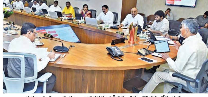
గురువారం సిఎం చంద్రబాబు అధ్యక్షతన జరిగిన మంత్రిమండలి సమావేశం దృశ్యం

మంత్రిమండలి సమావేశంలో ఆమోదం ప్రభుత్వరంగ సంస్థలు, గురుకులాల్లో లిటెరేట్స్ 62 యేళ్లకు పెంపు కొత్త ఏవియేషన్ పాలసీ, ఎక్సైజ్ పాలసీ మార్గదర్శకాలను ఆమోదించిన కేబినెట్ అవయవ మార్పిడి చట్టం అమలుకు నిర్ణయం