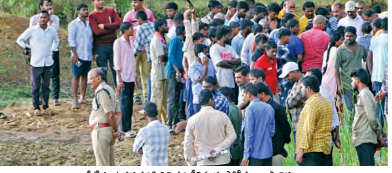
నీటిగుంటపల్లె పరిశ్రామిక పరిశోధన, పోలీసులు, స్థానికులు

బీహార్ లోని ఆస్పత్రి విసియులో అగ్నిప్రమాదం ఐదుగురు మృతి, పలువురికి తీవ్రగాయాలు పాట్నా, జూన్ 4: బీహార్ లో పెను విషాదం చోటుచేసుకుంది. ఆస్పత్రి విసియులో అగ్ని ప్రమాదం జరిగిన ఫలితంలో ఐదుగురు ప్రాణాలు కోల్పోగా 20 మంది వరకూ తీవ్రంగా గాయ పడ్డారు. గురువారం తెల్లవారుజామున ఈ ప్రమాదం జరిగింది. ముజఫర్ పూర్ జిల్లాలోని ఓ ఆస్పత్రి విసియులో గురువారం తెల్లవారుజామున 3.55 గంటల ప్రాంతంలో అగ్నిప్రమాదం చోటుచేసుకుంది. ప్రమాదం జరిగిన సమయంలో విసియులో 20 మంది రాకా పేషంట్లు ఉన్నారు. వారందరూ మంటల్లో వికల్పబోయారు. అగ్ని తీసివేయడం వెంటనే అగ్నిమాపక సిబ్బందికి సమాచారం ఇచ్చారు. సమాచారం అందిన వెంటనే అగ్నిమాపక సిబ్బందితో పాటు పోలీసులు కూడా సంఘటనా స్థలానికి చేరుకున్నారు. సహాయక చర్యలు చేపట్టారు. >>2