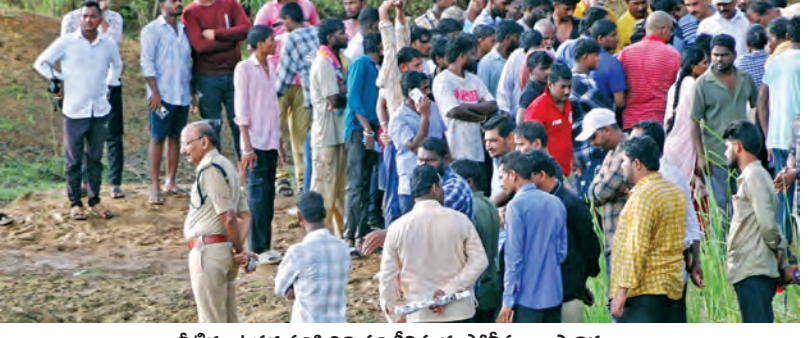
నీటిగుంటపల్లె పరిస్థితిని పరిశీలిస్తున్న పోలీసులు, స్థానికులు

బీహార్ లోని ఆస్పత్రి విసియులో అగ్నిప్రమాదం బిదుగురు మృతి, పలువురికి తీవ్రగాయాలు పాట్నా, జూన్ 4: బీహార్ లో పెను విషాదం చోటుచేసుకుంది. ఆస్పత్రి విసియులో అగ్ని ప్రమాదం జరిగిన ఫలితంలో బిదుగురు ప్రాణాలు కోల్పోగా 20 మంది వరకూ తీవ్రంగా గాయ పడ్డారు. గురువారం తెల్లవారుజామున ఈ ప్రమాదం జరిగింది. ముజఫర్ నగర్ జిల్లాలోని ఓ ఆస్పత్రి విసియులో గురువారం తెల్లవారుజామున 3.55 గంటల ప్రాంతంలో అగ్నిప్రమాదం చోటుచేసుకుంది. ప్రమాదం జరిగిన సమయంలో విసియులో 20 మంది రాకా పేషంట్లు ఉన్నారు. వారందరూ మంటల్లో బిక్కుబిక్కుయారు. అగ్ని తీసివేయడం వెంటనే అగ్నిమాపక సిబ్బందికి సమాచారం ఇచ్చారు. సమాచారం అందిన వెంటనే అగ్నిమాపక సిబ్బందితో పాటు పోలీసులు కూడా సంఘటనా స్థలానికి చేరుకున్నారు. >>2