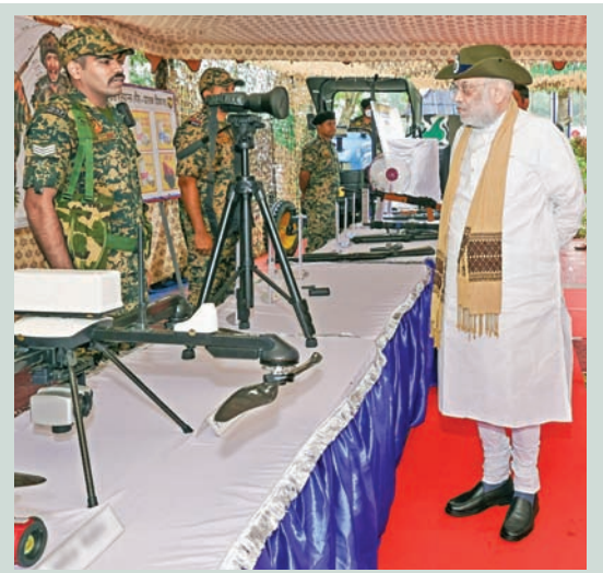
శుక్రవారం త్రిపురలోని భారత్ - బంగ్లాదేశ్ సరిహద్దులో ఉన్న లంకామూరా బోర్డర్ బెటేపోస్టుపద్ద బానిసల అత్యాచారానికి ఆయుధాలను తనిఖీ చేస్తున్న హోంమంత్రి లమితేషా