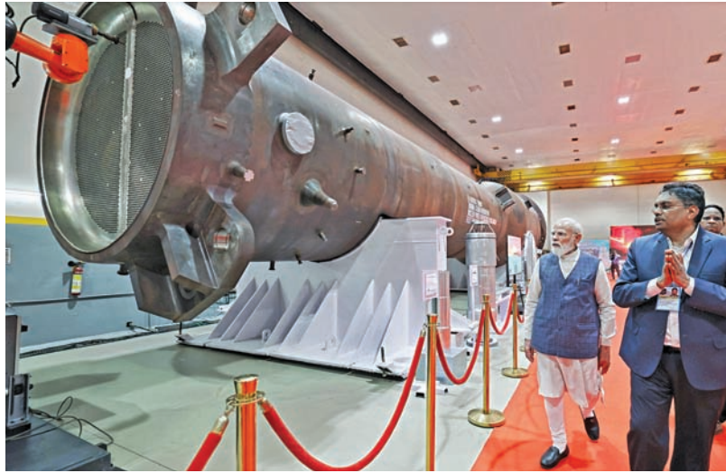
శుక్రవారం సూరత్ లోని హజరాత్ ఉన్న ఎల్ అండ్ డి ఫ్లాంట్ ను సందర్శించిన ప్రధాని మోడీ

న్యూఢిల్లీ, మార్చి 5, జూన్ 5: భారత వైమానిక దళ ఆధునికీకరణ, తగ్గుతున్న ఫైటర్ స్కాన్డన్ల సంఖ్య భర్తీ, స్పెడెక్ ఇదో తరం యుద్ధ విమానాల అభివృద్ధి వంటి కీలక లక్ష్యాల మధ్య రష్యా మరోసారి సు57 యుద్ధవిమాన ప్రాజెక్టులో భాగస్వామ్యం కావాలని భారత్ కు ఆహ్వానం పలికింది. రష్యా అధ్యక్షుడు వ్లాదిమిర్ పుతిన చేసిన తాజా వ్యాఖ్యలు రక్షణ రంగంలో మళ్లీ చర్చకు దారితీశాయి. దశాబ్దానికి పైగా క్రితం భారత్ రష్యా కలిసి ఇదో తరం యుద్ధ విమానం అభివృద్ధి చేయాలని ప్రతిపాదించిన విషయం తెలిసింది. అప్పట్లో భారత్ వేచి చూసే విధానాన్ని ఎంచుకోగా, రష్యా స్వతంత్రంగా ప్రాజెక్టును ముందుకు తీసుకెళ్లింది. ప్రస్తుతం సుఖోయ్ 57 సుపర్ డిఉండంతో పాటు విదేశీ మార్కెట్లలో కూడా దానిని ప్రోత్సహిస్తున్న రష్యా, కొనుగోలు మాత్రమే కాకుండా ఉత్పత్తి పరియం భవిష్యత్ అభివృద్ధిలో భాగస్వామ్యం కావాలని భారత్ ను కోరుతోంది. సుఖోయ్ డిజైన్ బ్యూరో అభివృద్ధి చేసిన సు57 రష్యా తొలి కార్యచరణలో ఉన్న ఇదో తరం స్పెల్ యుద్ధ విమానం. అమెరికా తయారీ ఎఫ్22 రాకెట్, ఎఫ్35 క్రెట్టింగ్ వంటి విమానాలకు పోటీగా దీన్ని రూపొందించారు. రాధాకృష్ణ తర్వాతగా కనిపించే స్పెల్ సాంకేతికత, సూపర్ క్రూజింగ్ సామర్థ్యం, అత్యధిక సెనాల్ వ్యవస్థలు, ఎలక్ట్రానిక్ వార్ ఫార్మ్ సదుపాయాలు, దీర్ఘ శ్రేణి దూరం సామర్థ్యం వంటి లక్ష్యాలు ఇందులో ఉన్నాయని రష్యా చెబుతోంది. ఈ విమానం గగనతల అధికత్యం సాధించడం, భూభాగ్ లక్ష్యాలపై దాడులు, ఎలక్ట్రానిక్ యుద్ధ చర్చలు, ఖచ్చితమైన దీర్ఘ శ్రేణి దాడులు వంటి వరు విధుల కోసం ఉపయోగించవచ్చని రష్యా చెబుతోంది.