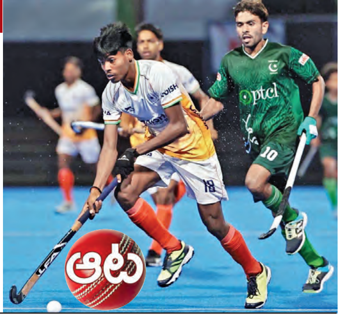
అట ఫైనల్లో జపాన్ తో డి