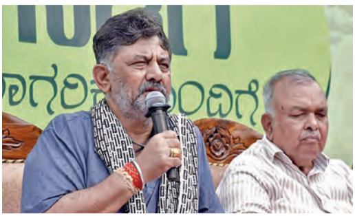
వింగళూరు, జూన్ 6: కర్ణాటక ప్రభుత్వంలో మంత్రివర్గ విస్తరణ తర్వాత వెలరేగిన అసమ్మతి నెగలు సద్గుణుడిగా. శాఖల కేటాయింపుపై తీవ్ర అసంతృప్తితో తన మంత్రి పదవికి

న రామలింగారెడ్డిని బుజ్జగించిన నియం డిక్రీ - రాజీనామా నిర్ణయం విరమించిన మంత్రి