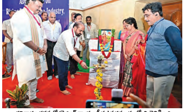
శనివారం కడపలో 'రైజింగ్ రాయలసీమ' సదస్సును జ్యోతి వెలిగించి ప్రారంభిస్తున్న రాష్ట్ర ఆరోగ్య కుటుంబ సంక్షేమ శాఖ మంత్రి నత్తకుమార్

కడప, కాల్వారెడ్డి, జూన్ 6 ప్రభాతవార్త: రాయలసీమను కరువు, వలసల ప్రాంతంగా కాకుండా పరిశ్రమలు, పెట్టుబడులు, ఉపాధి అవకాశాల కేంద్రంగా తీర్చిదిద్దడమే రాష్ట్ర ప్రభుత్వ లక్ష్యమని రాష్ట్ర ఆరోగ్య, కుటుంబ సంక్షేమ శాఖ మంత్రి నై నత్తకుమార్, రాష్ట్ర పరిశ్రమలు, వాణిజ్య శాఖ మంత్రి టిజి