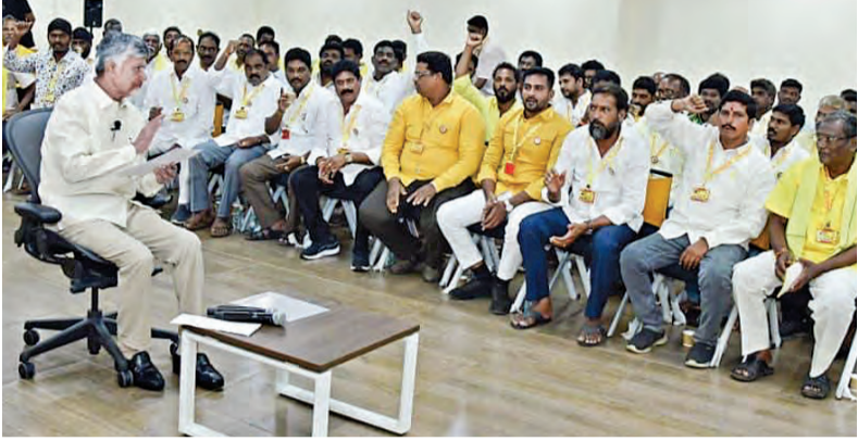
శనివారం టిడిపి కేంద్ర కార్యాలయంలో క్షస్టర్ ఇన్ చార్జీలకు నిర్వహిస్తున్న వర్క్ షాపులో మాట్లాడుతున్న సిఎం చంద్రబాబు

విజయవాడ, జూన్ 6, ప్రభాతవార్త ప్రతినిధి: ఆరోగ్యవంతమైన సమాజనిర్మాణంలో ప్రజలు కీలక భాగస్వాములు కావాలని సిఎం చంద్రబాబు అన్నారు. సైకిల్తో ఆరోగ్యం, పర్యావరణ హితో పాటు ఇంధన పొదుపుకూడా జరుగుతుందన్నారు. పర్యావరణ దిశోన్మతం లోజున ప్రజల్లోకి మంచి సందేశం తీసుకెళ్లమని చెప్పారు. నాయకులుకూడా సైకిల్ తోకి, ప్రజలు ఆ స్ఫూర్తిని అందిస్తున్నారని నేలా చేశారని సిఎం ప్రశంసించారు. శనివారం టిడిపి కేంద్ర కార్యాలయంలో తెలుగుదేశం క్షస్టర్ ఇన్ చార్జీలకు నిర్వహిస్తున్న వర్క్ షాపుకు ఆయన