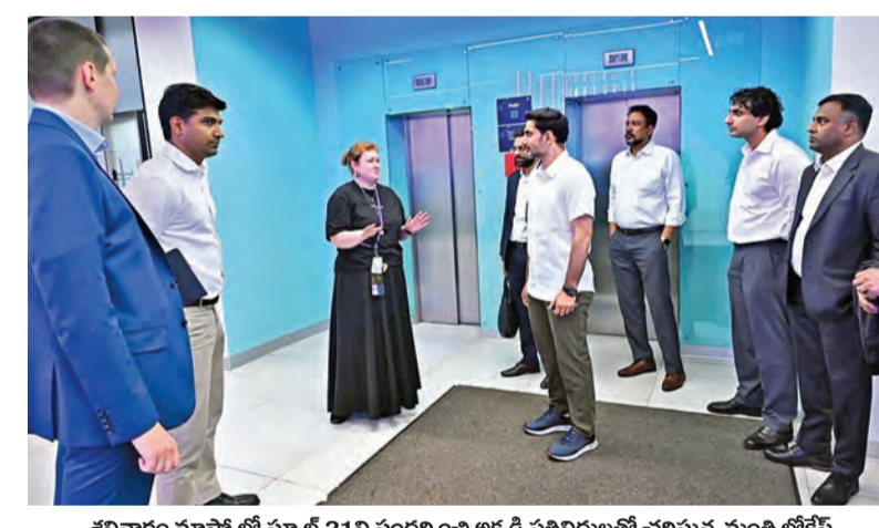
శనివారం మాస్కోలో స్కూల్ 21ని సందర్శించి అక్కడి ప్రతినిధులతో చర్చిస్తున్న మంత్రి లోకేశ్

స్కూలు-21ను సందర్శించి ప్రతినిధులతో చర్చలు జరిపిన మంత్రి లోకేశ్ తోటి విద్యార్థులే అధ్యాపకులు, ప్రాజెక్టు ఆధారిత పాఠాలు