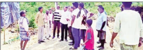
దమ్మపేట, జూన్ 6 ప్రభాతవార్త:

మండలంలోని పాతలచ్చాపురం గ్రామంలో జరుగుతున్న అంతర్గత విద్యుత్ నూతన విద్యుత్ లైన్ల ఏర్పాటు పనులను ఎమ్మెల్యే జారె ఆదినారాయణ శనివారం పరిశీలించారు. ఎమ్మెల్యే జారె అధికారులకు అవసరమైన సూచనలుచేశారు. అనంతరం గ్రామస్థులతో మాట్లాడి వారి సమస్యలు వారి అవసరాలను తెలుసుకున్నారు. గ్రామాభివృద్ధి, మౌలిక సదుపాయాల కల్పనకు రాష్ట్ర ప్రభుత్వం అత్యంత ప్రాధాన్యత ఇస్తోందని అన్నారు. గ్రామ ప్రజలు ఎన్నాళ్లుగానో ఎదురుచూస్తున్న విద్యుత్ సమస్యకు త్వరితగతిన పరిష్కారం చూపిన ఎమ్మెల్యే గ్రామస్థులు కృతజ్ఞతలు తెలిపారు. ప్రజల అవసరాలే తమకు ముఖ్యమని నియోజకవర్గంలోని ప్రతి గ్రామానికి మెరుగైన మౌలిక సదుపాయాలు అందించేందుకు కృషి కొనసాగిస్తామని హామీ ఇచ్చారు. ఈ కార్యక్రమంలో స్థానిక కాంగ్రెస్ పార్టీ నాయకులు, విద్యుత్ శాఖ అధికారులు, గ్రామ పెద్దలు గ్రామస్థులు పాల్గొన్నారు.