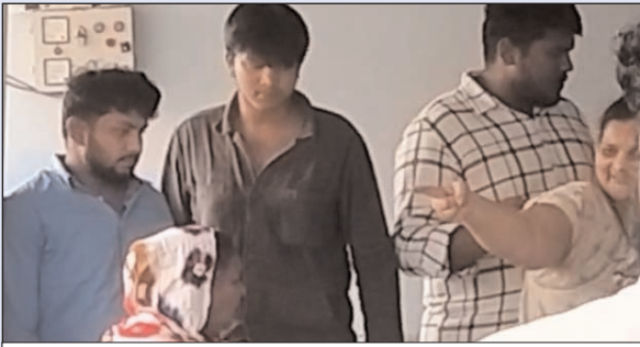
బాధితులతో వాగ్వివాదం పెట్టుకుంటున్న నిందితుని కుటుంబ సభ్యులు

ఐదేళ్లుగా డబ్బుల కోసం తిరుగుతూనే ఉన్నామని, చివరకు అప్పులు తీర్చేందుకు తమ ఆస్తులు కూడా అమ్ముకోవాల్సి వచ్చిందని వారు ఆవేదన వ్యక్తం చేశారు. కొందరు అప్పుల బాధతో కుటుంబాలను పోషించలేని పరిస్థితికి చేరుకున్నారని, మరికొందరు అప్పిచ్చిన వారి ఒత్తితో తీవ్ర మానసిక వేదన అనుభవిస్తున్నారని తెలిపారు.