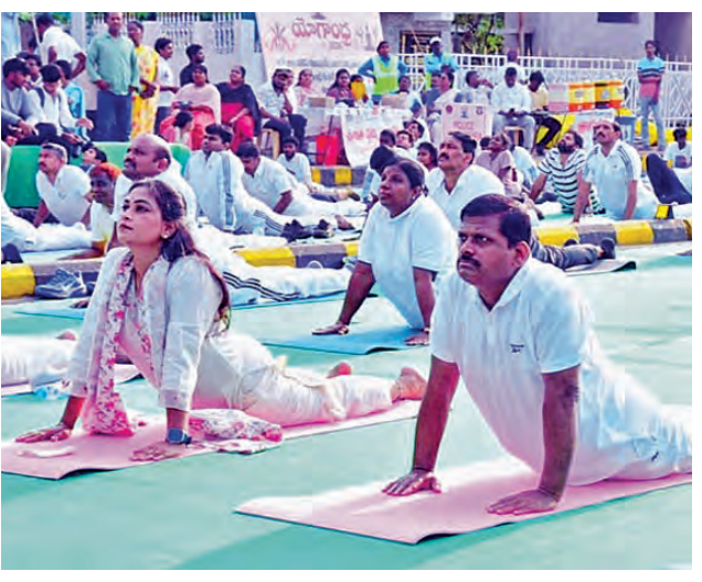
ఆదివారం విజయవాడలో యోగాసనాలు చేస్తున్న హోంమంత్రి వంగలపూడి అనిత