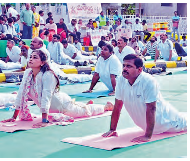
ఆదివారం విజయవాడలో యోగాసనాలు చేస్తున్న హోంమంత్రి వంగలపూడి అనిత