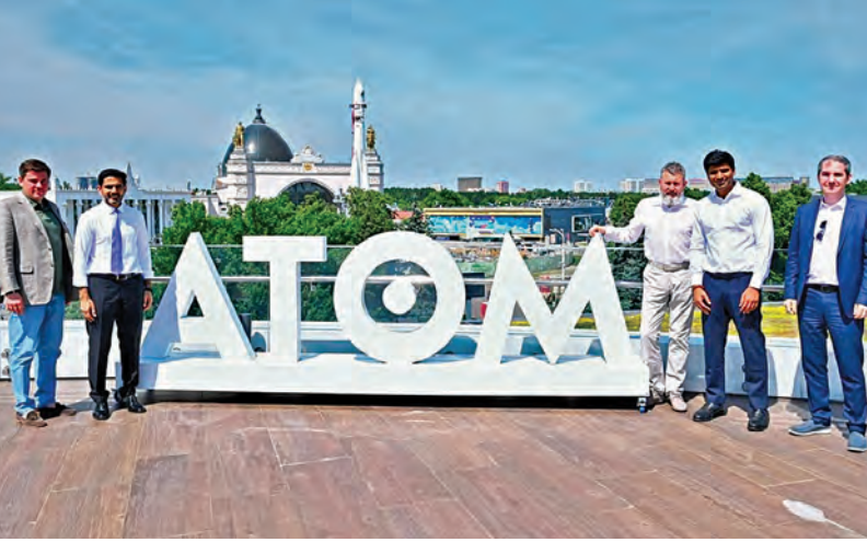
మాస్కోలో అడివారం అణుశక్తి మ్యూజియం వద్ద గిరెడ్వేట్ ప్రతినిధులతో మంత్రి లోకేష్

>>> కూడిన తేలికపాటి నుంచి మోస్తరు వర్షాలు.. కురిసిన అవకాశం ఉందన్నారు. అలాగే మిగతా జిల్లాల్లో అక్కడక్కడ పీడుగులతో కూడిన ..తేలికపాటి వర్షాలు.. కురిసిన అవకాశం ఉందని తెలిపారుఆకస్మికంగా ఈదురుగాలులు, ఉరుములతో వర్షం పడే సమయంలో ప్రజలు చెట్ల క్రింద, విద్యుత్ స్తంభాలు, హోల్స్ లోని క్రింద నిలబడొద్దని సూచించారు. హిలాల్లో పనిచేసే రైతులు, పశుకాపరులు మరింత అప్రమత్తంగా ఉండాలని, ఆకాశం మేఘావృత్తుల ఉరుములు వినిపించిన వెంటనే సురక్షిత ప్రాంతాలకు వెళ్లాలన్నారు. వర్షపు గాలుల వల్ల ఎక్కడానికీ విద్యుత్ వైర్లు తెగిపడి ఉంటే వాటిని గమనిస్తూ, వాటికి వీలైనంత దూరంగా ఉండాలన్నారు.