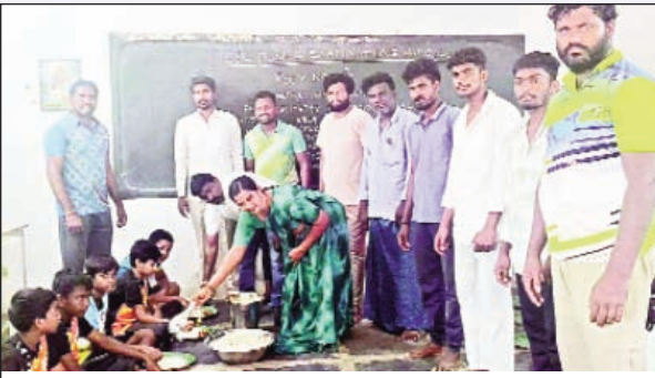
నడిగూడెం, జూన్ 7, ప్రభాతవార్త: