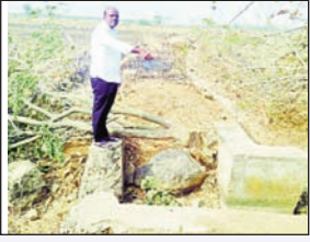
బిలుకూరు, జూన్ 7, ప్రభాతవార్త :