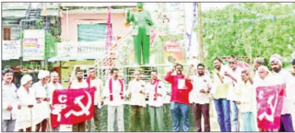
మోటకొండూర్, జూన్ 07, ప్రభాతవార్త