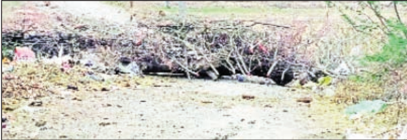
అనంతగిరి జూన్ 07 ప్రభాత వార్త:

మూడు గ్రామాలకు నిలిచిపోయిన రాకపోకలు విషయం తెలిసినా పట్టించుకోని అధికారులు