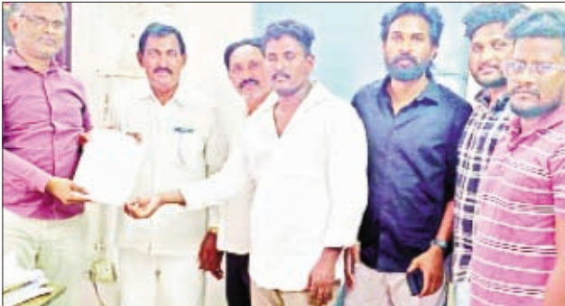
ఎర్నాటుకు చొరవ తీసుకోవలసి కోరారు. వారి వెంట కాంగ్రెస్ నాయకులు, యువత తదితరులున్నారు.