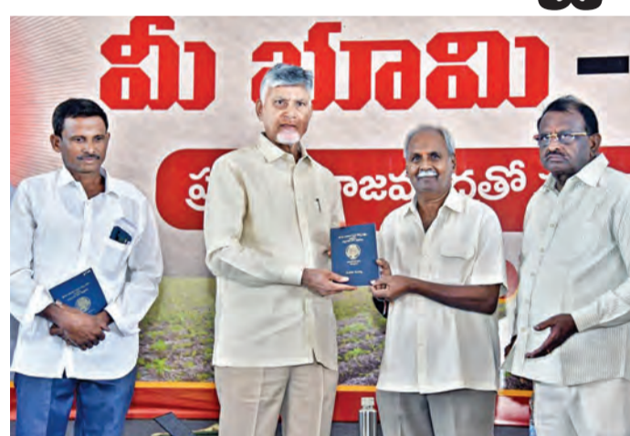
సోమవారం సిద్దాంతం పభలో పాస్ పుస్తకాల అందచేస్తున్న సిఎం చంద్రబాబు

అచంట, జూన్ 8 ప్రభాతవార్త: 2027 నాటికి రాష్ట్రంలో భూ రికార్డులను ప్రక్షాళన చేసి ప్రజలకు అందుబాటులో ఉంచుతామని ముఖ్యమంత్రి చంద్రబాబు నాయుడు స్పష్టం చేశారు. గత పాలకులు పశ్చిమగోదావరి జిల్లా లాంటి పచ్చని ప్రాంతంలోనూ భూ విద్యు పెట్టారని ముఖ్యమంత్రి ఆక్షేపించారు. గణం భూమిని కూడా సద్ది నియోగం చేసుకునే రైతులనూ గత ప్రభుత్వం వదిలి పెట్టలేదని తీవ్రస్థాయిలో ఆరోపించారు. పశ్చిమ గోదావరి జిల్లా సిద్దాంతంలో 'మీ భూమి మీ హక్కు' పేరిట రాజు ముద్రతో కూడిన పట్టాదారు పాస్ పుస్తకాల పంపిణీ కార్యక్రమంలో ముఖ్యమంత్రి పాల్గొన్నారు. దుర్భాగ్యమైన గత పాలకుల నిర్ణయంతో రికార్డులన్నీ గందరగోళంగా తయారయ్యాయని ప్రజలకు చెందిన భూముల విషయంలో నమ స్థూల స్పష్టంచారని పేర్కొన్నారు. ప్రభుత్వ ఆధీనంలో ఉండాలని భూ రికార్డులను ప్రైవేటు వ్యక్తులకు అప్పగించే ప్రయత్నం చేశారని అన్నారు. ప్రజా ప్రభుత్వం అధికారంలోకి వచ్చాకే ల్యాండ్ టైటిలింగ్ యాక్ట్ లాంటి దుర్భాగ్య పట్టాన్ని రద్దు చేసి యాజమాన్య హక్కుల్ని రక్షించామని వివరించారు. క్యూ ఆర్ కోడ్ సహా కర్నూల్ నోట్ల తరహా లోనే అత్యంత పటిష్టమైన భద్రతా ఫీచర్లతో రాజమహేంద్రవరం కూడిన పట్టాదారు పాస్ పుస్తకాలను జారీ చేస్తున్నామని తెలిపారు. గత పాలకులు చేసిన అవతతవల కారణంగా భూమి రికార్డుల ప్రక్షాళనకు 3 ఏళ్ల సమయం పడుతుందని సిఎం అన్నారు. దేశం లోనే తొలిసారి భాక్స్ ప్లెన్ ఆధారిత భూ రికార్డుల వ్యవస్థను ఆమలు చేస్తున్నామని