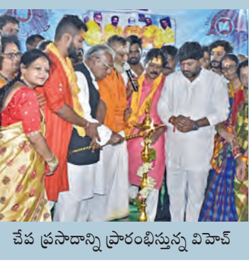
చేప ప్రసాదాన్ని ప్రారంభిస్తున్న విహార్

మృగశిర వేళ.. చేప ప్రసాదం వివిధ రాష్ట్రాల నుంచి అధిక సంఖ్యలో వచ్చిన అస్తమా వ్యాధిగ్రస్తులు