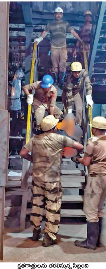
క్షతగాత్రులను తరలిస్తున్న సిబ్బంది