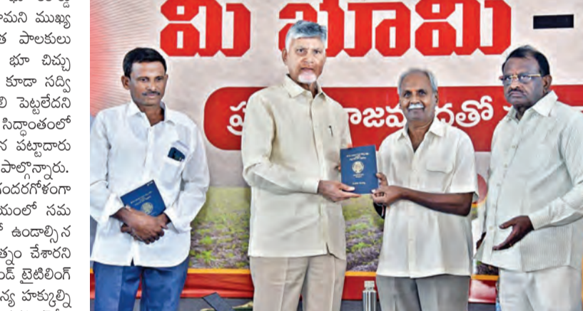
సోమవారం సిద్దాంతం పభలో పాస్ పుస్తకాలు అందచేస్తున్న సిఎం చంద్రబాబు

అవంతి, జూన్ 8 ప్రభాతవార్త: 2027 నాటికి రాష్ట్రంలో భూ రికార్డులను ప్రక్షాళన చేసి ప్రజలకు అందుబాటులో ఉంచుతామని ముఖ్యమంత్రి చంద్రబాబు నాయుడు స్పష్టం చేశారు. గత పాలకులు పశ్చిమగోదావరిజిల్లా లాంటి పచ్చని ప్రాంతంలోనూ భూ వివృత పేట్రలని ముఖ్యమంత్రి ఆక్షేపించారు. గణం భూమిని కూడా సద్ది నియోగం చేసుకునే రైతులనూ గత ప్రభుత్వం వదిలి పెట్టలేదని తీవ్రస్థాయిలో ఆరోపించారు. పశ్చిమ గోదావరి జిల్లా సిద్దాంతంలో 'మీ భూమి మీ హక్కు' పేరిట రాజు ముద్రతో కూడిన పట్టాదారు పాస్ పుస్తకాల పంపిణీ కార్యక్రమంలో ముఖ్యమంత్రి పాల్గొన్నారు. దుర్భాగ్యమైన గత పాలకుల నిర్ణయంతో రికార్డులన్నీ గందరగోళంగా తయారయ్యాయని ప్రజలకు చెందిన భూముల విషయంలో నమ స్థూల స్పష్టంచారని పేర్కొన్నారు. ప్రభుత్వ ఆధీనంలో ఉండాలని భూ రికార్డులను ప్రైవేటు వ్యక్తులకు అప్పగించే ప్రయత్నం చేశారని అన్నారు. ప్రజా ప్రభుత్వం అధికారంలోకి వచ్చాకే ల్యాండ్ టైటిలింగ్ యాక్ట్ లాంటి దుర్భాగ్య పట్టాన్ని రద్దు చేసి యాజమాన్య హక్కుల్ని రక్షించామని వివరించారు. క్యూ ఆర్ కోడ్ సహా కర్నూల్ నోట్ల తరహా లోనే అత్యంత పటిష్టమైన భద్రతా ఫీచర్లతో రాజమహేంద్రవరం కూడిన పట్టాదారు పాస్ పుస్తకాలను జారీ చేస్తున్నామని తెలిపారు. గత పాలకులు చేసిన అవకతవకల కారణంగా భూమి రికార్డుల ప్రక్షాళనకు 3 ఏళ్ల సమయం పడుతుందని సిఎం అన్నారు. దేశం లోనే తొలిసారి భాక్స్ ప్లెన్ ఆధారిత భూ రికార్డుల వ్యవస్థను ఆమలు చేస్తున్నామని