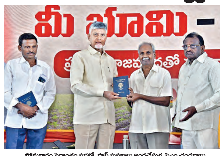
సోమవారం సిద్దాంతం సభలో పాస్ పుస్తకాల అందచేస్తున్న సిఎం చంద్రబాబు

అవంతి, జూన్ 8 ప్రభాతవార్త: 2027 నాటికి రాష్ట్రంలో భూ రికార్డులను ప్రక్షాళన చేసి ప్రజలకు అందుబాటులో ఉంచుతామని ముఖ్యమంత్రి చంద్రబాబు నాయుడు స్పష్టం చేశారు. గత పాలకులు పశ్చిమగోదావరిజిల్లా లాంటి ప్రాంతంలోనూ భూ విప్లవం పెట్టారని ముఖ్యమంత్రి ఆక్షేపించారు. గణం భూమిని కూడా సద్వినియోగం చేసుకునే రైతులనూ గత ప్రభుత్వం వదిలి పెట్టలేదని తీవ్రస్థాయిలో ఆరోపించారు. పశ్చిమ గోదావరి జిల్లా సిద్దాంతంలో 'మీ భూమి మీ హక్కు' పేరిట రాజు ముద్రతో కూడిన పట్టాదారు పాస్ పుస్తకాల పంపిణీ కార్యక్రమంలో ముఖ్యమంత్రి పాల్గొన్నారు. దుర్భాగ్యులను గత పాలకుల నిర్లక్ష్యంతో రికార్డులన్నీ గందరగోళంగా తయారయ్యాయని ప్రజలకు చెందిన భూముల విషయంలో నమస్కరణలు చేశారు. ప్రభుత్వ ఆధీనంలో ఉండాలని భూ రికార్డులను ప్రైవేటు వ్యక్తులకు అప్పగించే ప్రయత్నం చేశారని ఆన్నారు. ప్రజా ప్రభుత్వం అధికారంలోకి వచ్చాకే ల్యాండ్ ట్రైబియూనల్ లో యాక్ట్ లాంటి దుర్భాగ్యుల పట్టాన్ని రద్దు చేసి యాజమాన్య హక్కుల్ని రక్షించామని వివరించారు. క్యూ ఆర్ కోడ్ సహా కరెన్సీ నోట్ల తరహాలోనే అత్యంత పటిష్టమైన భద్రతా ఫీచర్లతో రాజముద్రతో కూడిన పట్టాదారు పాస్ పుస్తకాలను జారీ చేస్తున్నామని తెలిపారు. గత పాలకులు చేసిన అవకతవకల కారణంగా భూమి రికార్డుల ప్రక్షాళనకు 3వార్ల సమయం వదుతుందని సిఎం ఆన్నారు. దేశం లోనే తొలిసారి ఖాక్ వైస్ ఆధారిత భూ రికార్డుల వ్యవస్థను అమలు చేస్తున్నామని వెల్లడించారు. ప్రతి యూనిట్ కు శాశ్వతమైన ఖాక్ వైస్