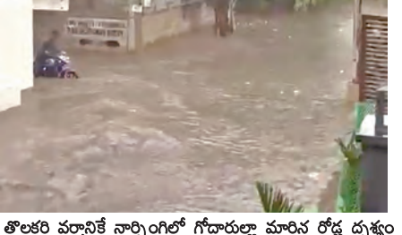
తొలకరి వర్షానికే నార్సింగిలో గోదారులుగా మారిన రోడ్డు దృశ్యం

నార్సింగి, జూన్ 9 ప్రభాతవార్ల : తొలకరి వర్షానికే నార్సింగి సర్కిల్ పరిధిలోని రోడ్డు గోదారులుగా మారాయి. కేవలం 20 నిమిషాల పాటు కురిసిన వర్షానికే నార్సింగిలోని బాలాజీ నగర్లో మూడు ఫీట్ల ఎత్తులో వరద నీరు రోడ్డుపై పారింది. ద్వితీయ వర్షం వానలన్నీ నీటి మునిగిపోయాయి. వాహనదారులు ఈ రోడ్డుపై వెళ్లేందుకు సుమారు గంట సమయం ట్రాఫిక్ లో ఇరుకుపోయారు. ప్రతిఏటా బాలాజీ నగర్లో వరద నీటిలో స్నానికులు బెంజెలెత్తిపోతున్నారు. మా కాలనీలో వరద నీటి ఇబ్బందులు తొలగించాలని బాలాజీ నగర్ ప్రజలు అనేకసార్లు స్థానిక రాజకీయ నాయకులు, అధికారులకు ఫిర్యాదులు, విన్నపాలు చేసినా ఎవరూ స్పందించడం లేదు. ఈ సారి తొలకరి వర్షానికే వరదం ఎత్తులో వరద నీరు పారడంతో స్నానికులు భయాందోళన వ్యక్తం చేస్తున్నారు. 20 నిమిషాల వర్షానికే వరద నీరు ఇంతగా పొంగితే ఇక రాత్రంతా వర్షం కురిస్తే మా పరిస్థితి ఏమిటని కాలనీ వాసులు ఆవేదన చెందుతున్నారు. వేసవిలోనే వరద నీటి కాలువల పూడికను తీయడం, వరద నీరు నిలువ ఉండే ప్రాంతాలలో