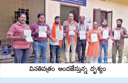
విసతివల్ల అందిస్తున్న దృశ్యం