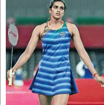
సిద్ధి: ఈ సీజన్లో అయిదు నెలలు పూర్తయినా భారత్ బ్యాడ్మింటన్ స్టార్ పీవీ సింధూ బైటిల్ సాధించడంలో విఫలమవుతోంది. గెలిగ్ ఫూల్, థాయ్ లాండ్ ఓపెన్ లో క్వార్టర్స్ లో ఓడిన సింధూ.. ఇండోనేసియా ఓపెన్ రెండో రౌండ్ లో ఓడిపోయింది. దీంతో మంగళవారం ప్రారంభమైన ఆసీన్ ఓపెన్ మరోసారి బైటిల్ కోసం సింధూ బరిలో దిగుతోంది.

మొరాకో ప్రమాదకర జట్టుగా ఎదిగింది. 2018 వరకు నాలుగుసార్లు మాత్రమే ప్రపంచకప్ నకు అర్హత సాధించిన మొరాకో... 2022లో అంచనా లను తలకిందులు చేస్తూ నంచలన ప్రదర్శనతో ఆశ్చర్యంలో ముంచెత్తింది. క్యాంపియన్ లో బలమైన పోర్చుగల్ కు పోటీస్తూ.. సెమీఫైనల్ కు దూసుకెళ్లింది. ఫిఫా ప్రపంచకప్ లో సెమీస్ చేరిన తొలి అఫ్రికా జట్టుగా పరిత్ర సృష్టించింది. ఈసారి కూడా క్యాంపియన్ లో మెరుగైన ప్రదర్శన చేసి, గ్రూప్ విజేతగా నిలిచిన మొరాకోపై మంచి అంచనాల్ ఉన్నాయి. మొరాకో జట్టులో అలాహ్ హాకిమ్, బ్రహీమ్ దియాన్, సాఫ్వాన్ అబ్రూహాత్ కీలక అటామిక్లు ఉన్నారు.