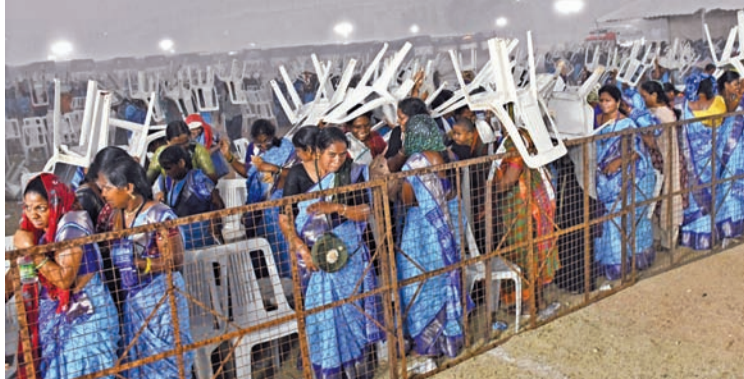
పెరేడ్ గ్రౌండ్స్ ని ఉ సభలో భారీ వర్షం రావడంతో కుర్చీలు అడ్డుగా పెట్టుకున్న ప్రజలు