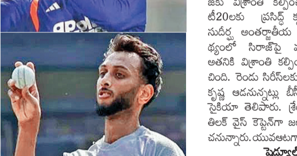
ముంబై: బిర్లాండ్, ఇంగ్లండ్ టూర్ కోసం ప్రకటించిన టీమిండియా జట్టులో కీలక మార్పు జరిగింది. హైదరాబాద్ ఎన్టీఆర్ మహమ్మద్ సిరా

జ్ కు వికాంత కలిపింది. అతని స్థానంలో టీ20లకు ప్రసిద్ధ్ కృష్ణను ఎంపిక చేసింది. సుదీర్ఘ అంతర్జాతీయ సీజన్ ముందున్న నేపథ్యంలో సిరాజ్ పర్మనెంట్ తగ్గించేందుకు అతనికి వికాంత కలిపించినట్లు టీసీసీఐ వెల్లడించింది. రెండు సిరీస్ లకు సిరాజ్ స్థానంలో ప్రసిద్ధ్ కృష్ణ ఆడనున్నట్లు టీసీసీఐ కార్యదర్శి దేవజిత్ సైకియా తెలిపారు. శ్రీయన్ అయ్యర్ కెప్టెన్ గా, తిలక్ వైస్ కెప్టెన్ గా జట్టును ముందుకు నడిపించనున్నారు.యువఅటామిక్లకు అవకాశం దక్కింది.