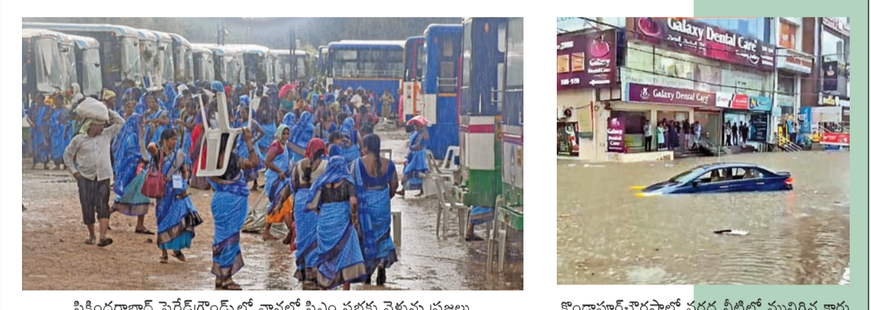
సికిందరాబాద్ పెరెడ్డిగ్రౌండ్స్ లో వానలో సిఎం సభకు వెళ్తున్న ప్రజలు కొండాపూర్ చౌరస్తాలో వరద నీటిలో మునిగిన కారు