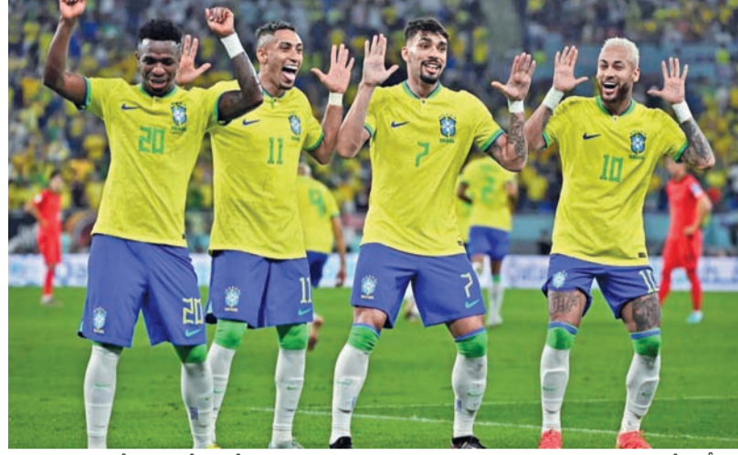
అనుమానాల నేపథ్యంలో.. కోచ్ మార్పు ఆ జట్టుకు ఎంతో మేలు చేసింది. కాల్లో ఆస్పిలోటి బాధ్యతలు స్వీకరించాడు.. ఆఖరి నాలుగు క్యాంపియన్ల మ్యాచ్ లో మూడు గెలిచిన బ్రెజిల్ ప్రపంచకప్ నకు అర్హత సాధించింది. జట్టు ప్రపంచకప్ లోనూ మొదట ప్రదర్శన చేస్తుంది అభిమానులు ఆశలు పెట్టుకున్నారు.

ప్రపంచం మొత్తం ఎదురుచూస్తున్న మెగా ఈవెంట్ రానే వచ్చింది. రేపటి నుంచి సాకర్ ప్రపంచకప్ ఆరంభం కానుంది. ఆడుతున్నది 48 ఓవర్లు అయినా.. మిలియన్ల మంది చూడతూ దీనిపైనే జూలై 19 వరకు ఈ సాకర్ నందించే ఫుట్ బాల్ అభిమానులను ఉర్రూతలూగించనుంది. ఫిఫా ప్రపంచకప్ లో వలు మేటి జట్టుల్లా అందరి చూపు సాంబా టీమ్ పైనే అత్యధికంగా 5నార్లు సాకర్ ప్రపంచకప్ ను బ్రెజిల్ అందుకుంది. చివరిసారి 2002లో ప్రపంచకప్ విజేతగా నిలిచింది. దాదాపు 24 ఏళ్లుగా బ్రెజిల్ ను ట్రోఫీ ఊరిస్తోంది. ఈసారి సుదీర్ఘ నిరీక్షణకు తెరదించాలని సాంబా టీమ్ ఫోకస్ పెట్టింది.