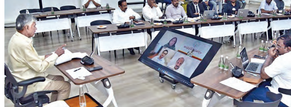
మంగళవారం అల్లీజిఎస్ సమీక్షలో ముఖ్యమంత్రి చంద్రబాబు

ప్రమాదం జరిగిన ప్రదేశాన్ని పరిశీలిస్తున్న మంత్రి లోకేశ్ బాధితులను పూర్తిగా ఆదుకొంటాం మంత్రి లోకేశ్ హామీ, విశాఖ చేరిన ముగ్గురు సభ్యుల కమిటీ విశాఖపట్నం, జూన్ 9 ప్రభాతవార్త: విశాఖ ఉక్కు కర్మాగారంలో జరిగిన దుర్ఘటనలో ప్రాణాలు కోల్పోయిన కార్మికుల కుటుంబాలకు రాష్ట్ర ప్రభుత్వం పూర్తి స్థాయిలో అండగా ఉంటుందని రాష్ట్ర ఐటీ, విద్యాశాఖ మంత్రి నారా లోకేశ్ హామీ ఇచ్చారు. కేజ్రీహామ్ మాట్లాడుతూ మృతుల కుటుంబాలను, వివిధ ఆసుపత్రుల్లో >>7