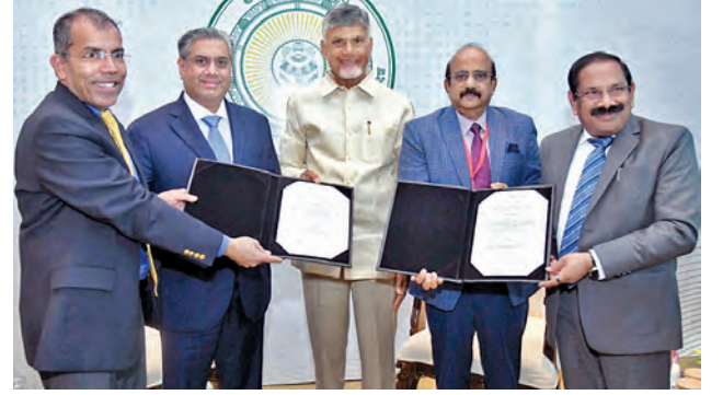
సిఎం చంద్రబాబు సమక్షంలో జరిగిన ఓ పారిశ్రామిక ఒప్పందం (ఫైల్)

విజయవాడ, జూన్ 9 ప్రభాతవార్త: ఆంధ్రప్రదేశ్ పారిశ్రామిక ముఖవితం శరవేగంగా మారుతోంది. రెండేళ్లలో సిఎం చంద్రబాబు నేతృత్వంలోని కూటమి ప్రభుత్వం తీసుకున్న చర్యలతో పెద్ద ఎత్తున పెట్టుబడులు ఏపీకి వస్తున్నాయి. ప్రభుత్వాన్ని ఏర్పాటు చేసినప్పటి నుంచి సిఎం చంద్రబాబు పారిశ్రామిక విధానంలో తన సైల్ మార్చారు. గతానికి భిన్నంగా వెళ్లడం మొదలు పెట్టారు. 201419 మధ్య కాలంలో నాటి ప్రభుత్వం స్పీడ్ ఆఫ్ డూయింగ్ బిజినెస్ విధానాన్ని అవలంబించింది. ఆ స్పీడుతోనే నాడు కొన్ని కీలక పెట్టుబడులు తెచ్చింది. కియా కార్ల కంపెనీని తెచ్చి ఉమ్మడి ఆనంతపురం జిల్లా.. ప్రత్యేకించి పెనుకొండ ప్రాంతం రూపు రేఖలు మార్చింది. ఇప్పుడు స్పీడ్ ఆఫ్ డూయింగ్ బిజినెస్ నుంచి ఈజ్ ఆఫ్ డూయింగ్ బిజినెస్ వైపు కూటమి ప్రభుత్వం అడుగులు వేసింది. దీనిలో భాగంగా పెద్ద ఎత్తున పెట్టుబడులు వచ్చాయి. భారీ స్థాయిలో ఎంఓయాలను కుదుర్చు కున్నారు. గత రెండేళ్ల కాలంలో సుమారు 800 కంపెనీలు ఏపీలో పెట్టుబడులు పెట్టేందుకు ఆసక్తిని కనబరిచాయి. ప్రస్తుతం రెండేళ్ల కాలంలో రూ.23 లక్షల కోట్ల పెట్టుబడులు పెట్టేందుకు వివిధ కంపెనీలు ఆసక్తి కనబరిస్తే.. వీటి ద్వారా సుమారు 23 లక్షల ఉద్యోగాలు రాసన్నాయి. వీటిలో రూ.21.64 లక్షల కోట్ల పెట్టుబడులు వివిధ ఎంఓయాల ద్వారానే వస్తున్నాయి.