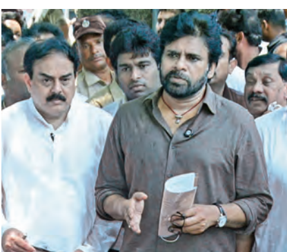
మంగళవారం విశాఖలో మీడియాతో డి.సి.ఎం పవన్

మృతుల కుటుంబాలకు రూ. 25 లక్షల పరిహారం, ఉద్యోగం: డి.సి.ఎం పవన్ కల్యాణ్