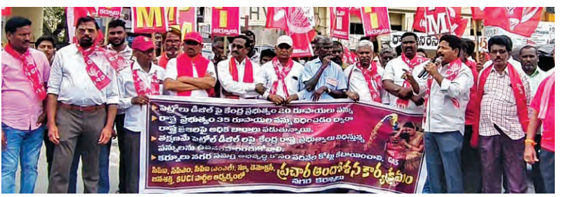
మంగళవారం కర్నూలులో రాస్తా రోకో చేస్తున్న వామపక్షాలు

290 గిగావాట్ల స్థాపిత సామర్థ్యంతో అమెరికాను దాటిన వైనం సౌరశక్తి, పవనశక్తిలో 3.4 స్థానాలు: కేంద్రమంత్రి ప్రవీణ్ జోషి తిరుపతి, జూన్ 9, ప్రభాతవార్త: పునరుత్పాదక ఇంధన రంగంలో 290 గిగావాట్ల స్థాపిత సామర్థ్యంతో భారత్ అమెరికాను అధిగమించింది, సౌరశక్తి పవనశక్తి రంగాల్లో ప్రపంచంలో వరుసగా మూడు, నాలుగో స్థానాల్లో భారత్ నిలిచింది కేంద్ర వినియోగదారుల వ్యవహారాలు, అవకాశ, పునరుత్పాదక ఇంధన శాఖల మంత్రి ప్రవీణ్ జోషి తెలిపారు. గత 12 సంవత్సరాల్లో ప్రధానమంత్రి మోడీ నాయకత్వంలో దేశ ఆర్థిక వ్యవస్థ గణనీయంగా అభివృద్ధి చెందింది, మౌలిక సదుపాయాల అభివృద్ధి ద్వారా భారత్ పెట్టుబడులు, యువతకు ఉపాధి అవకాశాలు అందించాయని పేర్కొన్నారు. గత 11 సంవత్సరాల్లో 60 వేల కిలో మీటర్లకు పైగా కొత్తరవాహులు, హైస్పీడ్ కారిడార్లు నిర్మించినట్లు వెల్లడించారు. సమీకాన్ ఇండియా కార్యక్రమం ద్వారా 1.69 >>7