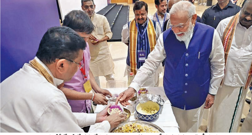
బుధవారం న్యూఢిల్లీలో ఎట్టియం సమావేశం సందర్భంగా అలాహాబాద్ విందు స్వీకరిస్తున్న ప్రధాని మోడీ తదితరులు