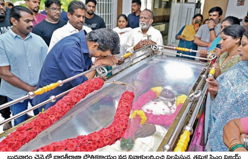
బుధవారం చెన్నైలో భారతీరాజా భారతీకాయం వద్ద నివాకులర్చించి విలపిస్తున్న తమిళ సిఎం విజయ్

>>> యేళ్లు పూర్తిచేసుకున్న ప్రధానిమోడీని ట్రియం అభినందిస్తూ "మిత్రునికి శుభాభినందనలు. భారతీకు సుదీర్ఘకాలం పనిచేసిన చేస్తున్న ప్రధానమంత్రి నాయకుడు మోడీ" ఆయన ఒక గొప్ప నాయకుడు అని శుభాకాంక్షలు తెలిపారు. ప్రధానిమోడీ శక్తివంతమైన గొప్ప నాయకుడని, అంతేకాకుండా ఆలోచనాశక్తి ఉన్న ప్రముఖ మేధావి అని కొనియాడారు. అమెరికా భారతీయలపై ఉన్న సంబంధాలు ఈ 12 యేళ్లకాలంలో మరింత పురోగమించాయని ఆయన ఈసందర్భంగా ప్రస్తావించారు. ఆయన మరింత సుదీర్ఘకాలం పనిచేసే కొనసాగి మరింత అభివృద్ధిలోకి తీసుకురావాలని ట్రియం ఆంక్షించారు.