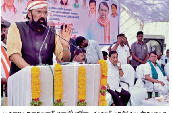
బుధవారం నిజామాబాద్ జిల్లాలో జికోరా-చందూర్ ఎత్తిపోతల ప్రారంభించిన ప్రసంగిస్తున్న మంత్రి ఉత్తమ్ కుమార్ రెడ్డి

హైదరాబాద్, జూన్ 10 ప్రభావవార్త: రాష్ట్రంలోని నీటిపారుదల ప్రాజెక్టులకు సంబంధించిన భూసేకరణ, పునరావాసం పునరుద్ధరణ, అటవీ అనుమతులు, ప్రత్యామ్నాయ అటవీకరణ వంటి సమస్యల పరిష్కారం కోసం ముఖ్యమంత్రి రూ.5,000 కోట్ల ప్రత్యేక ఆర్థిక ప్యాకేజీని ప్రకటించారని నీటిపారుదల శాఖ మంత్రి ఉత్తమ్ కుమార్ రెడ్డి తెలిపారు. రాష్ట్ర నీటిపారుదల, పౌర సరఫరాల