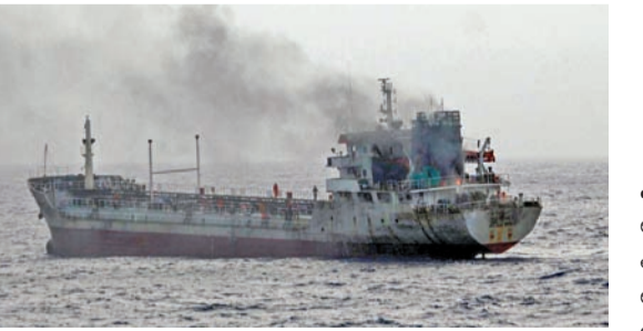
న్యూఢిల్లీ, జూన్ 10: గల్ఫ్ ఆఫ్ ఆడమ్స్ తీరంలో భారత్ కు వస్తున్న ఆయిల్ ట్యాంకర్లపై అమెరికా దళాలు దాడులు చేయడంపై భారత్ తీవ్ర నిరసన వ్యక్తం చేసింది. భారతీయ క్రాసింగ్ దిశగా ఈ ఆయిల్ ట్యాంకర్ లో ఉన్నారు. ఇప్పటికే ముగ్గురు భారతీయ సిబ్బంది అమాకీ తెలియదలలేదని భారత్ విదేశాంగ శాఖ వెల్లడించింది. అంత