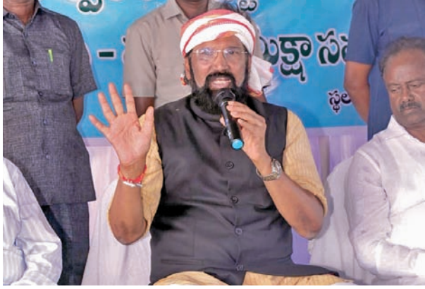
మాట్లాడుతున్న మంత్రి ఉత్తమ్ కుమార్ రెడ్డి

మహాదేవపూర్ (జయశంకర్ భూపాలపల్లి), ప్రభాతవార్త: రాష్ట్రంలో గత టీఆర్ఎస్ ప్రభుత్వం కేవలం కమిషన్ కోసమే కాళేశ్వరం ప్రాజెక్టును చేపట్టిందని, చేపెళ్ల నుండి మేడిగడ్డకు ప్రాజెక్టును మార్చి చేసి తెలంగాణకు తీరని ద్రోహం చేసిందని రాష్ట్ర సాగునీటి శాఖ మంత్రి నలమచి ఉత్తమ్ కుమార్ రెడ్డి తీవ్రస్థాయిలో ధ్వజమెత్తారు. బుద్ధవారం ఆయన మహాదేవపూర్ మండలం పరిధిలోని లక్ష్మీమ (మేడిగడ్డ) బ్యారేజీని సందర్శించి, ఆక్రమణ జరుగుతున్న పునరుద్ధరణ పనులను పరిశీలించారు. ఈ సందర్భంగా మంత్రి మీడియాతో మాట్లాడుతూ గత ప్రభుత్వంపై భూలు వ్యాఖ్యలు చేశారు. కాంగ్రెస్ హయాంలోనే 30 పనులు పూర్తి. దివంగత ముఖ్యమంత్రి వైఎస్ రాజశేఖర్ రెడ్డి హయాంలోనే రాష్ట్ర రైతాంగానికి సాగు, తాగునీరు అందించాలనే సకలబృంతో తాము ప్రాణహిత చేపెళ్ల ప్రాజెక్టును చేపట్టామని మంత్రి ఉత్తమ్ కుమార్ రెడ్డి గుర్తు చేశారు. కాంగ్రెస్ ప్రభుత్వం ఆధ్వర్యంలోనే ఈ ప్రాజెక్టు పనులను 30 శాతం వరకు పూర్తి చేశామని స్పష్టం చేశారు.