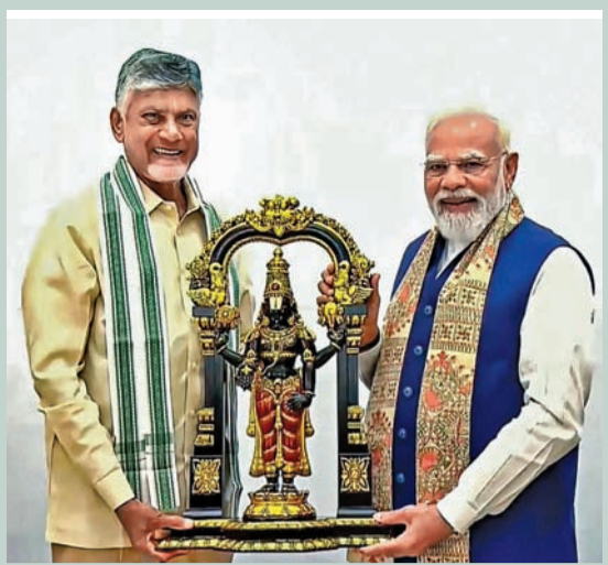
బుధవారం న్యూఢిల్లీలో ప్రధాని మోడీకి జ్ఞాపకము అందజేస్తున్న ఎపి సిఎం చంద్రబాబు నాయుడు