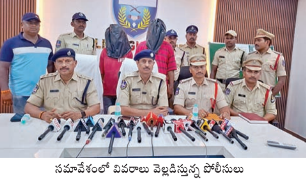
సమావేశంలో వివరాలు వెల్లడిస్తున్న పోలీసులు

గంటల్లోనే ప్రధాన నిందితుడి అరెస్ట్ పిస్టల్, తూటాలు, కత్తులు స్వాధీనం