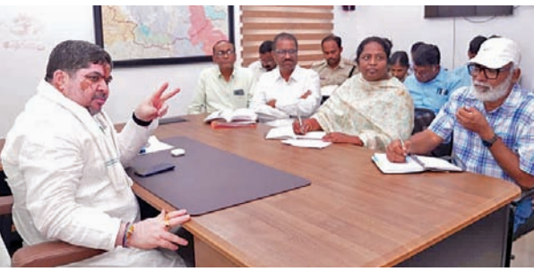
అధికారులతో మాట్లాడుతున్న మంత్రి పొన్నం ప్రభాకర్