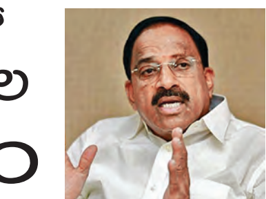
ఫోన్ ట్యాపింగ్ కేసులో మంత్రి తుమ్మల వాంగ్మూలం

సింగరేణిపై ప్రత్యేక తర్ఫీ చూపించండి రూ. 1,600 కోట్ల విలువైన 40 లక్షల టన్నుల బొగ్గు అధ్యక్షులపై అంశంపై దృష్టి సారించండి సిఎం రేవంత్ కు కేంద్ర మంత్రి కిషన్ రెడ్డి బహిరంగ లేఖ