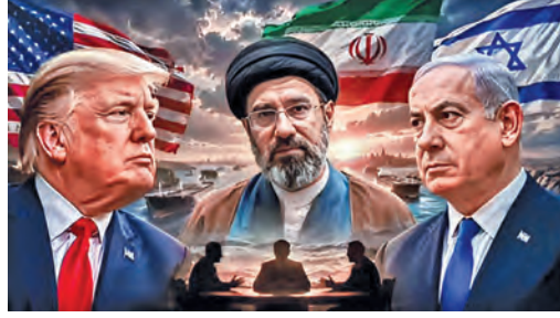
ఇస్లామాబాద్, జూన్ 13: దాదాపు 3 నెలలకు పైగా పశ్చిమాసియాలో తీవ్ర ఉద్రిక్తతలకు ముగింపు కార్డు పడుతోంది. స్విట్జర్లాండ్ రాజధాని జెనీవా వేదికగా ఒప్పందంపై అమెరికా, ఇరాన్, ఇజ్రాయేల్ ప్రతినిధులు సంతకాలు చేస్తూన్న సమావేశం వెలుగులోకి వచ్చింది. దీనికి తోడు ట్రంప్ కూడా తన ట్రూత్ సోఫ్ట్ వేర్ ఐపో వేసాడంటే

వార్కు ఫుల్ స్టామ్! జెనీవోలో ఇరాన్, అమెరికా శాంతి ఒప్పందానికి అంతా సిద్ధం ఉభయ పక్షాల మధ్య తుది చర్చలు ఒప్పందం ఖాయమన్న పాక్ ప్రధాని