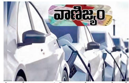
దీనివల్ల డీలర్లు కొత్త బుకింగ్స్ ను నిలిపివేశారని కంపెనీ ఎంపిఎల్ ఆఫ్ అయర్స్ తెలిపారు. డిమాండ్ బిజ్నెస్ ఇండియా సైతం ఇదే తరఫున వున్నవలన ఎదుర్కొంటోంది. మేనేజ్ లో ఆ కంపెనీ మొత్తం అమ్మకాల్లో ఈవీల వాటా 33 శాతానికి చేరుకోవడం విశేషం.

ముంబయి, జూన్ 13: ఫెట్రోలు డీజిల్ ధరలు అకాశాన్నంటుతున్న క్రమంలో, వాహనదారులు ఎలక్ట్రిక్ వాహనాలు ఈవీల వైపు మళ్లుతుండటంతో ఈవీ కార్లకు డిమాండ్ గణనీ పెరిగి, డెలివరీ కోసం నెలల తరబడి వేచిమాడాలిని పరిస్థితి నెలకొంది. మారుతి సుజుకి, టాటా మోటార్స్, మెర్సెడెస్ బెంజ్, మహీంద్రా వంటి ప్రముఖ కంపెనీల పాపులర్ మోడళ్ల కోసం ప్రస్తుతం 3 నెలల వరకు వెయిటింగ్ వీరియడే నడచుతోంది. పశ్చిమాసియా ఉద్వికృతలు వుజ్జుమా అని బయ్యర్లు ఇప్పుడు విద్యుత్ వాహనాలవైపు దృష్టి మార్చారు. ఆధిక ధరలు, ఛార్జింగ్ సదుపాయాల కొరత వంటి కారణాలతో ఈవీల కొనుగోలుకు వెనుకబడిన వినియోగదారులు, ఇప్పుడు వారు పైనే ఆసక్తి కనబరుస్తున్నారు.