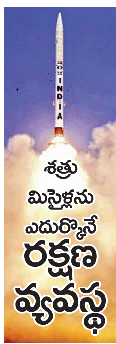
యాంటీ షిప్ మిస్సైళ్లను డీకొట్టే టెక్నాలజీని పరిశీలించిన డిఆర్డిఐల పెరిగిన స్వదేశీ రక్షణ సామర్థ్యం

శత్రు మిస్సైళ్లను ఎదుర్కొనే రక్షణ వ్యవస్థ యాంటీ షిప్ మిస్సైళ్లను డీకొట్టే టెక్నాలజీని పరిశీలించిన డిఆర్డిఐల పెరిగిన స్వదేశీ రక్షణ సామర్థ్యం