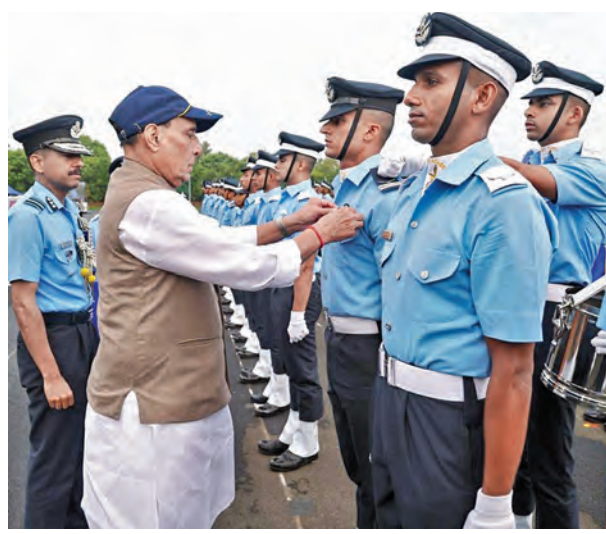
శనివారం దుండిగల్ ఎయిర్ ఫోర్స్ ఆకాడమీలో క్యాడెట్లకు వింగ్స్ ప్రదానం చేస్తున్న రక్షణ మంత్రి రాజీనాథ్ సింగ్

మన ఎయిర్ ఫోర్స్ సుపర్ బు యుద్ధతంత్రాన్ని మార్చివేసిన ఉపగ్రహాలు, డ్రోన్లు, రోబోటిక్స్ వైమానిక దళంలో నారీశక్తికి పెద్దపీట: రక్షణ మంత్రి రాజీనాథ్