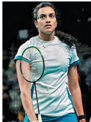
వింది. ఈ ఓటమితో 2026 సీజన్లో తొలి బీడబ్ల్యూఎఫ్ టైటిల్ అందుకోవాలన్న సింధూ కల చెడింది. కాగా ఈ సీజన్ బీడబ్ల్యూఎఫ్ టూర్ లో రెండు... సెమీఫైనల్లో ఓటమి రెండోసారి. జనవరిలో జరిగిన మరేషియా ఓపెన్ సూపర్ 1000 టోర్నీలోనూ సింధూ సెమీఫైనల్ వైనా పట్టణ వారి జియి వేటిలో ఓడింది. చివరగా 2024లో లక్నో వేదికగా జరిగిన నయ్యర్ మోడీ ఇంటర్నేషనల్ టైటిల్ నెగింది.

సింధూ: ఆస్ట్రేలియన్ ఓపెన్ సూపర్ 500 బ్యాడ్మింట్ టోర్నీలో భారత పట్టణం పాటు ముగిసింది. ఏకైక ఆశాకరణంగా ఉన్న పీవీ సింధూ కూడా ఫైనల్ చేరకుండానే వెనుదిరిగింది. మహిళల సింగిల్స్ సెమీఫైనల్లో సింధూ 20-22, 12-20 తో వరుస గేమ్ లో టాప్ సీడ్ జపాన్ పట్టణ అసానో యుమికి చేతిలో ఓడింది. 43 నిమిషాల పాటు జరిగిన ఈ సెమీస్ ఫోరులో నెగ్జన్ ప్రపంచ ఛాంపియన్ యుమికి ఫైనల్లో ప్రవేశించింది. సెమీఫైనల్ ఫోరును పీవీ సింధూ మంచి ఈజీతో ప్రారంభించింది. చక్కని నెట్ గేమ్ తో యుమికి ప్రదర్శించిన సింధూ... 12-6 తో ఆది డ్యుంట్లోకి దూసుకెళ్లింది. అయితే క్రీకే తర్వాత పరుగు ఆరు పాయింట్లు సాధించిన సమవుజ్జీ గా నిలిచింది. ఇద్దరూ పోటీపోటీగా పాయింట్లు రాబట్టడంతో 20-20 వరకు సమంగా కొనసాగింది. ఈ దశలో సింధూ గేమ్ లను తప్పింది. కీలక దశలో ఎర్లర్ల చేయడంతో... దీన్ని సద్వినియోగం చేసుకుంటూ యుమికి సులభంగా రెండు పాయింట్లు సాధించి గేమ్ ను సొంతం చేసుకుంది. ఇక రెండో గేమ్ లో సింధూ తేలిపోయింది. మరోవైపు జపాన్ పట్టణ సింధూకు ఎలాంటి అవకాశం ఇవ్వకుండా ఆధిక్యంలో దూసుకుపోయింది. రెండో గేమ్ ను మరంత అల వోకగా 21-12 తో ముగిసి ఫైనల్లో ప్రవేశించింది.