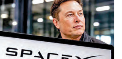
ఇక స్పేస్ ఓక్స్ వ్యవస్థాపకమైన ఎలాన్ మస్క్ ని ఈ లిస్టింగ్ తో ప్రపంచంలో తొలి బిలియనీర్ గా నిలిచారు. కంపెనీ ఉద్ద్యోగుల్లో గానీ వారి వేతనంపై ఉద్ద్యోగి 2012లో 80వేల డాలర్ల జీతంతో సంస్థలో చేరాడు. ఆ సమయంలో ఒక్కో షేరు విలువ కేవలం 13.8 డాలర్లు. అప్పట్లో స్పేస్ ఓక్స్ రాకెట్ ప్రయోగాలు పరుగులు విఫలమవుతున్నప్పటికీ, సగటు బోనస్ లకు బదులుగా షేర్లను స్వీకరించాలని ఆతడు తీసుకున్న నిర్ణయం ఇప్పుడు అతనిని నీలీ అపార సంపదను తెచ్చిపెట్టింది. ప్రస్తుతం అతని వద్ద 50,000కు పైగా షేర్లు ఉన్నాయి.

న్యూయార్క్, జూన్ 13: అంతరిక్ష పరిశోధన సంస్థ స్పేస్ ఓక్స్ భారీ స్థాయిలో నిర్వహించిన ఐపిఓ సంస్థ ఉద్ద్యోగులను మిలియనీర్లు చేసింది. సంస్థ షేర్ లిస్టింగ్ అనంతరం 4,400 మందికి పైగా ఉద్ద్యోగులు మిలియనీర్లుగా మారిపోయారు. నాన్ డెక్లార్డ్ ఒక్కో షేరు 150 డాలర్ల ధరకు స్పేస్ ఓక్స్ చేయగా, క్రేడిట్ ప్రారంభమైన వెంటనే షేరు ధర మరింత పెరిగింది. దీంతో సంస్థలో పనిచేస్తున్న ఇంజనీర్లు, రాకెట్ ప్రయోగాల సిబ్బంది, గంటలు వారీ వేతనంపై పనిచేసే కార్మికులు సైతం భారీ సంపదను సొంతం చేసుకున్నారు. వీరిలో దాదాపు 400 మంది తం చేసుకున్నారు. వీరిలో దాదాపు 400 మంది కుమిలి ఉండవచ్చు అంచనా. సాధారణంగా చాలా ఐపిఓల్లో వ్యవస్థాపకత బిలియనీర్లుగా మారుతారు. కానీ 400 మంది ఉద్ద్యోగులు ఈ స్థాయికి చేరుకోవడం అరుదైన విషయమని డాక్ డాబ్లో విశ్లేషకుడు అంబ్రోజియోస్ పేర్కొన్నారు.