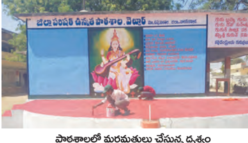
పాఠశాలలలో మరతులు చేస్తున్న దృశ్యం

ఉప్పునందల, జూన్ 14 ప్రభాతవార్త : వేసవి సెలవులు ముగియడంతో నేటి నుంచి ప్రభుత్వ పాఠశాలల పునఃప్రారంభం కానున్నాయి. ఏప్రిల్ 25 నుంచి జూన్ 11 వరకు ప్రకటించిన వేసవి సెలవులు ముగియగా, ప్రభుత్వం జూన్ 15 నుంచి విద్యార్థులకు పునఃప్రారంభానికి శ్రీకారం చుట్టింది. కొత్త విద్యా సంవత్సరానికి విద్యార్థులకు ఆహ్వానం పలుకుతూ మండలంలోని అన్ని ప్రభుత్వ పాఠశాలల్లో విస్తృత ఏర్పాట్లు పూర్తి చేశారు. పాఠశాలలు తిరిగి ప్రారంభం కానున్న సేవార్థంలో ప్రభుత్వ ఉపాధ్యాయులు గత కొన్ని రోజులుగా బడిబాట కార్యక్రమాన్ని నిర్వహిస్తూ ఇంటింటికీ వెళ్లి విద్యార్థుల నమోదు ప్రక్రియను చేపట్టారు. ప్రభుత్వ పాఠశాలల్లో నాణ్యమైన విద్య, ఉచిత పాఠ్యపుస్తకాలు, యూనిఫార్ములు, మధ్యాహ్న భోజనం, విద్యా సామగ్రి వంటి సౌకర్యాలపై తల్లిదండ్రులకు అవగాహన కల్పిస్తూ అధిక సంఖ్యలో ఆప్టిషన్లు సాధించేందుకు కృషి చేశారు. జూన్ 12న అన్ని పాఠశాలల ప్రధానోపాధ్యాయులు సన్మానక సమావేశాలు నిర్వహించి పాఠశాల ప్రారంభానికి అవసరమైన ఏర్పాట్లను సమీక్షించారు. విద్యార్థులకు అంది బియ్యంను లెకుండా తరగతి గదులు, తాగునీరు, మరుగుదొడ్లు, పరిశుభ్రత తదితర అంశాలపై ప్రత్యేక దృష్టి సారించారు. ముఖ్యంగా మధ్యాహ్న భోజనం పథకాన్ని సమర్థవంతంగా అమలు చేసేందుకు సంబంధిత ఏజెన్సీలతో సమావేశాలు నిర్వహించి ప్రభుత్వం నిర్దేశించిన మెనూ ప్రకారం నాణ్యమైన భోజనం అందించాలని సూచించారు. వేసవి సెలవుల కాలంలో మండలంలోని అధిక శాతం ఉపాధ్యాయులు జగణ్ అంబల్ పాల్గొన్నారు. జూన్ 9తో జనగణన ప్రక్రియ పూర్తికావడంతో ప్రస్తుతం విద్యా కార్యక్రమాలపై పూర్తిస్థాయిలో దృష్టి సారించారు. కొత్త విద్యా సంవత్సరానికి స్వాగతం పలుకుతూ పాఠశాలల ఆవరణలను శుభ్రపరిచి, విద్యార్థులను