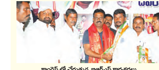
కాంగ్రెస్ లో చేరుతున్న బిఆర్ఎస్ కార్యకర్తలు