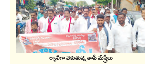
రాష్ట్రాని వెతుకుతున్న తాపీ మేస్త్రీలు

నిరసన తెలుపుతూ రాష్ట్ర : అధ్యక్షుడు గాలిగూటి జగదీష్