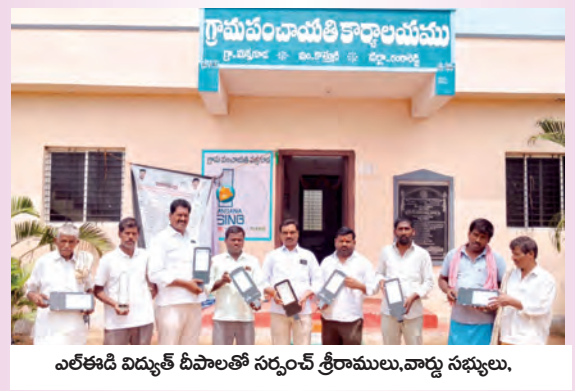
ఎలకాడి విద్యుత్ దీపాలతో సర్పంచ్ శ్రీరాములు,వార్డు సభ్యులు.