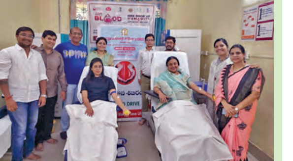
రక్తదానం చేస్తున్న మహిళలు

తాండూరు, జూన్ 14, ప్రభాతవార్త : ప్రపంచ రక్తదాన దినోత్సవాన్ని పురస్కరించుకొని రాజస్థాని మహిళా మండలి అధ్యక్షులతో రక్తదాన శిబిరం ఏర్పాటు చేశారు. ఆదివారం రాజస్థాని మహిళా మండలి అధ్యక్షులతో స్థానిక ప్రభుత్వ జిల్లా ఆసుపత్రిలో రక్త నిధి కేంద్రంలో 12మంది మహిళా మండలి సభ్యులు రక్తదానం చేశారు.