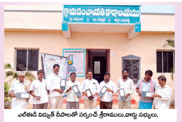
ఎలకాడి విద్యుత్ దీపాలతో సర్పంచ్ శ్రీరాములు,వార్డు సభ్యులు.