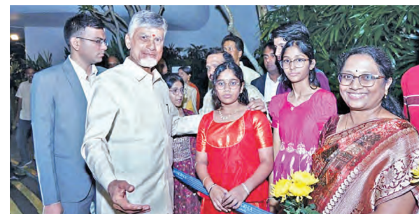
ఆదివారం సింగపూర్ చేరిన సింఘం చంద్రబాబుకు ఘనంగా స్వాగతం పలుకుతున్న ప్రవాస భారతీయులు

రెండు రోజుల పర్యటనకు వెళ్లిన సింఘం చంద్రబాబు బృందం స్టార్ట్ వేం చలర్ కేపిటలిస్టులతో భేటీ సింగపూర్ ప్రధాని లారెన్స్ వాంగ్, పలువురు మంత్రులతోనూ సమావేశాలు