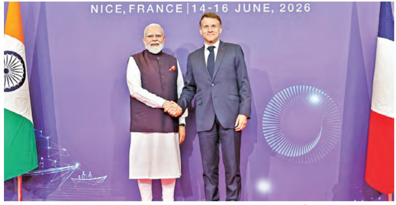
ఆదివారం ఫ్రాన్స్ లోని నైస్ నగరంలో భారత్ ఇన్ వేట్స్ కార్యక్రమంలో పాల్గొన్న ప్రధాని మోడీ, ఫ్రాన్స్ అధ్యక్షుడు మేక్రాన్

Published from Srikulam, Visakhapatnam, Vijayawada, Hyderabad, Rajahmundry, Guntur, Ongole, Nizamabad, Warangal, Tirupathi, Kadapa, Kurnool, Anantapur, Karimnagar, Mahabubnagar, Khammam, Nellore, Nalgonda, Tadepalligudem 15-6-2026 సోమవారం సంపుటి: 32 సంఠక: 135 పేజీలు: 16 వెల: 6.50