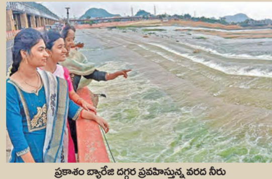
ప్రకాశం బ్యారేజి దగ్గర ప్రవహిస్తున్న వరద నీరు

ప్రకాశం బ్యారేజికి వరద కళ ఎగువ నుంచి భారీగా చేరుతున్న వర్షం నీరు