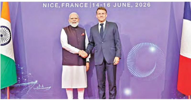
ఆదివారం ఫ్రాన్స్ లోని నైస్ నగరంలో 'భారత్ ఇనోవేట్స్' కార్యక్రమంలో పాల్గొన్న ప్రధాని మోడీ, ఫ్రాన్స్ అధ్యక్షుడు మేక్రాన్

15-6-2026 సోమవారం సంపుటి: 32 సంఛక: 135 పేజీలు: 16 వెల: 6.50