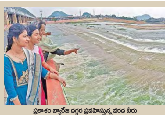
ప్రకాశం బ్యారేజి దగ్గర ప్రవహిస్తున్న వరద నీరు

విజయవాడ, జూన్ 14, ప్రభాతవార్త ప్రతినిధి: ఎగువ పరివాహక ప్రాంతాల్లో కురిసిన భారీ వర్షాల వల్ల కృష్ణా నది జలకళన సంతరించుకుంది. ప్రకాశం బ్యారేజి వద్ద నీటి ప్రవాహం పెరిగింది. దీంతో ఈ ఉదయం గేట్లను ఎత్తివేసారు అధికారులు. సుమారు 2,000 నుంచి 3,000 క్యూసెక్కుల నీటిని దిగువకు విడుదల చేశారు. నైరుతి రుతుపవనాలు ప్రవేశించిన తర్వాత ప్రకాశం బ్యారేజి నుంచి కృష్ణా నది దిగువ భాగానికి నీరు వరదలం ఇదే మొదటిసారి. తెలంగాణ, ఆంధ్రప్రదేశ్ భారీ వర్షాలు పడుతున్నాయి. దీంతో కృష్ణకు ఉప నది మున్నేరుకు వరద నీరు పెరిగింది. ఇదే సమయంలో వైకా, కృష్ణారేలుకు వరద నీరు పెరిగింది. ఈ వరద దిగువ కృష్ణా నదిలో కలుస్తుంది. దీంతో ప్రకాశం బ్యారేజికి భారీ వరద నీరు వచ్చి చేరుతుంది. ఇకపై వరద నీరు వర్షాల ప్రవాహంతో స్థానిక పరివాహక ప్రాంతాల నుంచి బ్యారేజికి వచ్చే నీటి ప్రవాహం పెరిగిందని అధికారులు తెలిపారు. దీంతో అదనపు నీటిని పరిమితంగా విడుదల చేసేలా నిర్ణయం తీసుకున్నారు. కృష్ణా నదిలో డివిజన్ ఎగ్జిక్యూటివ్ ఇంజనీర్ విడుదల చేసిన ప్రకారం ఈ ఉదయం 9 గంటల నుంచి 10 గంటల మధ్య నాలుగు గంటల వరకు, ఆ సమయంలో