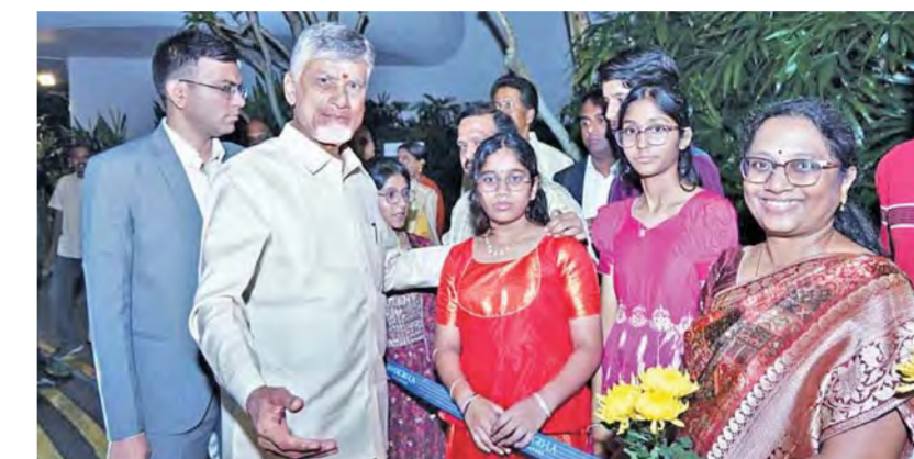
ఆదివారం సింగపూర్ చేసిన సింఘం చంద్రబాబుకు ఘనంగా స్వాగతం పలుకుతున్న ప్రవాస భారతీయులు

రెండు రోజుల పర్యటనకు వెళ్లిన సింఘం చంద్రబాబు బృందం స్టార్టప్ వెంచర్ కేపిటలిస్టులతో భేటీ సింగపూర్ ప్రధాని లారెన్స్ వాంగ్, పలువురు మంత్రులతోనూ సమావేశాలు