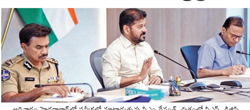
ఆదివారం హైదరాబాద్ లో సమీక్షలో మాట్లాడుతున్న సి.ఎం రేవంత్. చిత్రంలో సి.ఎం. రేవంత్, డి.జి.పి

వర్షాల వేళ అధికారులు, పోలీసులు రోడ్లపైనే ఉండాలి కోర్ అర్జన్ రిజియన్ లో మరింత అప్రమత్తం ట్రాఫిక్ జాం అయితే సహించను అలసత్వం వహిస్తే అధికారులపై కఠిన చర్యలు సమీక్షలో సిఎం రేవంత్ రెడ్డి ఆదేశాలు