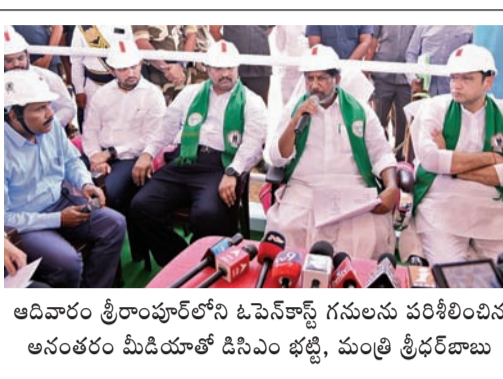
ఆదివారం శ్రీరాంపూర్ లోని ఓపెన్ క్యాన్స్ గనులను పరిశీలించిన ఆనంతరం మీడియాతో డి.సి.ఎం భట్టి

సింగరేణి నుంచి నాణ్యమైన బొగ్గు ఉత్పత్తి పెరగాలి సంస్థ మరింత బలోపేతం కావాలి