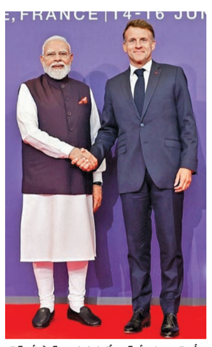
ఫ్రెన్చీ ప్రాన్స్ అధ్యక్షుడు మేక్రాన్ తో ప్రధాని మోడీ

'భారత్ ఇన్నోవేట్ వేట్స్' ప్రపంచానికి ఒక ఆహ్వానం ఫ్రాన్స్ అధ్యక్షుడు మేక్రాన్ తో కలిసి పాల్గొన్న ప్రధాని మోడీ మేక్ ఇన్ ఇండియాను ఫ్రాన్స్ గౌరవిస్తుంది: మేక్రాన్ ప్రవాసభారతీయులతో ప్రధాని మోడీ భేటీ