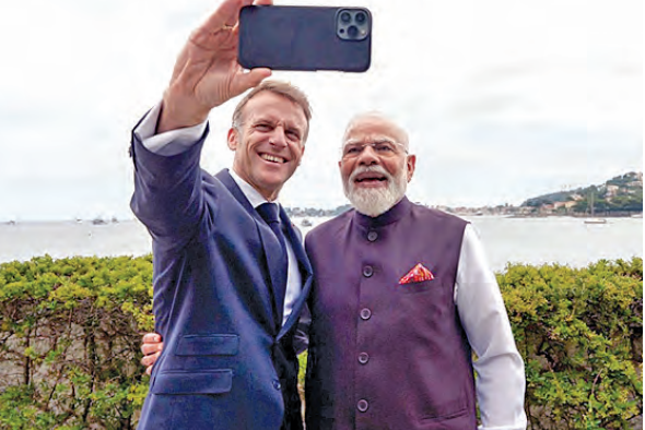
పారిస్, జూన్ 15: భారత ప్రధానమంత్రి నరేంద్రమోడీ ఫ్రాన్స్ పర్యటనకు సంబంధించి ఆ దేశ అధ్యక్షుడు ఇమ్మాన్యుయేల్ మెక్రాన్ ఆసక్తికర పోస్టు

చేశారు. భారత్-ఫ్రాన్స్ సంబంధాలకు బాటపూరి టవ్ ఇస్తూ, ప్రధాని మోడీ ఫ్రాన్స్ పర్యటన సందర్భంగా ఆయన 'షేర్ చేసిన ఓ వీడియో సోషల్ మీడియాలో వైరల్ గా మారింది. బాటిల్ టైట్ల 'ధరంధర'లోని ప్రముఖ 'అరీ ఆ' పాటను బ్యాక్గ్రౌండ్ లో ప్లే చేస్తూ మోడీ పర్యటనలోని ముఖ్య ఘట్టాలను ఆ వీడియోలో పొందుపరిచారు. సుమారు 30 సెకన్ల నిడివి ఉన్న ఈ వీడియోను 'ఎక్స్', ఇన్స్టాగ్రామ్ లో మెక్రాన్ పోస్టు చేశారు. మోడీ, మెక్రాన్ పరస్పరం కరచాలనం చేసుకోవడం, ఆహ్వానంగా అలింగనం చేసుకోవడం నుంచి వీడియో ప్రారంభమవుతుంది. అనంతరం ఫ్రాన్స్ లోని నీస్ నగరంలో మోడీ పార్లొన్స్ కార్యక్రమాలు, ఇరు దేశాల మధ్య సాంకేతికత, అభివృద్ధి, పునరాభివృద్ధి భాగస్వామ్యం సందర్భించిన దృశ్యాలు కనిపిస్తాయి. భారతీయ పాప కల్చర్ ను మెక్రాన్ తన సోషల్ మీడియా పోస్టులో ఉపయోగించడం ఇదే తొలిసారి కాదు. గతంలో కూడా భారత్ పర్యటన ముగిసిన తర్వాత 'ధరంధర' సంబంధించిన సంగీతం కూడా వీడియోను ఆయన 'షేర్' చేశారు. దీంతో భారతీయ నెటిజన్ల నుంచి మంచి స్పందన లభించింది.