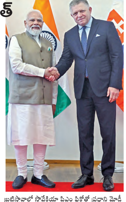
బ్రటిస్లావాలో స్లోవేకియా పిఎం ఫికోతో ప్రధాని మోడీ

డిజిటల్ టెక్నాలజీ, రక్షణ, సైబర్ సెక్యూరిటీ తదితర రంగాలలో దైవాక్షిక ఒప్పందాలు భారత్ కు రావాలని స్లోవేకియా పిఎం రాబర్ట్ ఫికోకు ప్రధాని మోడీ ఆహ్వానం