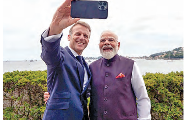
పారిస్, జూన్ 15: భారత ప్రధానమంత్రి నరేంద్రమోడీ ఫ్రాన్స్ పర్యటనకు సంబంధించి ఆ దేశ అధ్యక్షుడు ఇమ్మాన్యుయేల్ మెక్రాన్ ఆసక్తికర పోస్టు

చేశారు. భారత్-ఫ్రాన్స్ సంబంధాలకు బాటిల్ నెక్ అనిపిస్తున్న ఫ్రాన్స్ పర్యటన సందర్భంగా ఆయన పేర్ చేసిన ఓ వీడియో సోషల్ మీడియాలో వైరల్ గా మారింది. బాటిల్ నెక్ బ్రితం 'పరంభర'లోని ప్రముఖ 'అరీ ఆ' పాటను బ్యాక్ గ్రౌండ్ లో ప్లే చేస్తూ మోడీ పర్యటనలోని ముఖ్య ఘట్టాలను ఆ వీడియోలో పొందుపరిచారు. సుమారు 30 సెకన్ల నిడివి ఉన్న ఈ వీడియోను 'ఎక్స్', ఇన్స్టాగ్రామ్ లో మెక్రాన్ పోస్టు చేశారు. మోడీ, మెక్రాన్ పరస్పరం కరచాలనం చేసుకోవడం, ఆహ్వానంగా అలింగనం చేసుకోవడం నుంచి వీడియో ప్రారంభమవుతుంది. ఆనంతరం ఫ్రాన్స్ లోని సీన్ నగరంలో మోడీ పార్లమెంట్ కార్యక్రమాల, ఇరు దేశాల మధ్య సాంకేతికత, అభివృద్ధి, పునరుద్ధరణ భాగస్వామ్యాలకు సంబంధించిన దృశ్యాలు కనిపిస్తాయి. భారతీయ పాప కల్చర్ ను మెక్రాన్ తన సోషల్ మీడియా పోస్టులో ఉపయోగించడం ఇదే తొలిసారి కాదు. గతంలో కూడా భారత్ పర్యటన ముగిసిన తర్వాత 'పరంభర' సంబంధించిన సంగీతంతో కూడిన వీడియోను ఆయన పేర్ చేశారు. దీంతో భారతీయ నెటిజన్ల నుంచి మంచి స్పందన లభించింది.