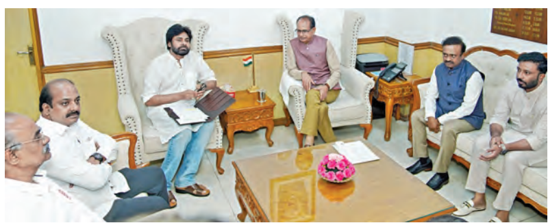
మంగళవారం ఢిల్లీలో కేంద్ర మంత్రి శివరాజ్ సింగ్ చౌహాన్ తో డి.సి.ఎం పవన్ సమావేశమైన దృశ్యం

జి-7 సమ్మిట్ లో ఉభయాల భేటీ • 16 నెలల తర్వాత ఇద్దరు అధినేతలు ముఖాముఖి • నేడు ఇద్దరు మధ్య ద్వైపాక్షిక సమావేశం పారిస్, జూన్ 16: ఫ్రాన్స్ లోని ఎవిఎన్ లో జరుగుతున్న జి7 సదస్సు సందర్భంగా భారత ప్రధానమంత్రి నరేంద్రమోడీ మరియు అమెరికా అధ్యక్షుడు డొనాల్డ్ ట్రంప్ మంగళవారం పరస్పరం కలుసుకుని మాట్లాడారు. గత 16 నెలల తర్వాత ఈ ఇద్దరునేతలు ముఖాముఖిగా సమావేశమడం విశేషం. ఇద్దరు నేతలు వివరసారిగా 2025 ఫిబ్రవరిలో అమెరికా రాజధాని వాషింగ్టన్ డి.సి.లోని వైట్ హౌస్ లో భేటీ అయ్యారు. ట్రంప్ రెండోసారి అధ్యక్ష బాధ్యతలు స్వీకరించిన అనంతరం జరిగిన ఆ సమావేశం తర్వాత ఇదే తొలి ప్రత్యక్షసమావేశం. జి7 సదస్సు >>2