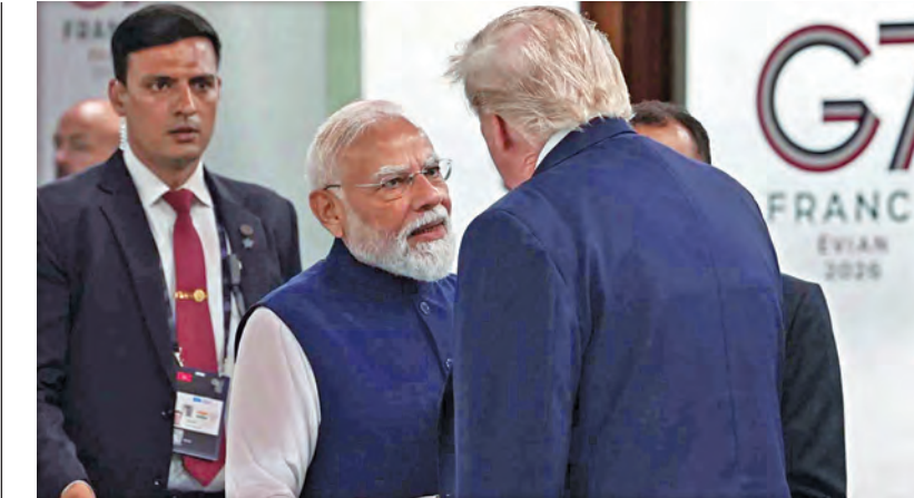
మంగళవారం ఫ్రాన్స్ లోని ఎవిఎన్ లో జి-7 సమ్మిట్ సందర్భంగా కలుసుకున్న ట్రంప్, మోడీ

విజయవాడ జూన్ 16: ప్రభాతవార్త ప్రతినిధి: భూమి, సీరు, మౌలిక వసతులు, అత్యుత్తమ పాలనలతో పెట్టుబడులకు ఎపి అత్యంత అనుకూల స్థానమని ముఖ్యమంత్రి చంద్రబాబు నాయుడు అన్నారు. స్పీడ్ ఆఫ్ డూయింగ్ బిజినెస్ లో ఎపిదే పేటెంట్ అని, పెట్టుబడులకు ఎంతో సురక్షితమని స్పష్టం చేశారు. ఈ ఏడాది విశాఖలో తలపెట్టిన పార్ట్ నెట్ వర్క్ సమ్మిట్ కు సన్మాహుకంగా సింగపూర్ లో సిఐఐ నిర్వహించిన బిజినెస్ రోడ్ షోలో ముఖ్యమంత్రి పాల్గొని ప్రసంగించారు. ఈ సందర్భంగా సిఎం మాట్లాడుతూ... 'సింగపూర్ తో భారత్ కు, ప్రత్యేకించి ఎపికి మంచి సంబంధాలు ఉన్నాయి. సింగపూర్ నిర్మాత లీ క్వాన్ యా అంటే నాకు చాలా అభిమానం. 3 దశాబ్దాలుగా సింగపూర్ తో కలిసి పనిచేస్తున్నాం. ఉమ్మడి ఆంధ్రప్రదేశ్ రాష్ట్రంలో హైదరాబాద్ లో సింగపూర్ టోన్ పిఎన్ నిర్మించాం. ఆంధ్రప్రదేశ్ రాష్ట్ర విభజన తర్వాత కొత్త రాజధాని నిర్మాణం కోసం సింగపూర్ మాస్టర్ ప్లాన్ తయారు చేసి ఇచ్చింది. బ్యా, గ్రీన్ రాజధానిగా ఓ అద్భుతమైన బృహత్ ప్రణాళికను సింగపూర్ రూపొందించి అందించింది. ఆంధ్రప్రదేశ్ రాజధాని అమరావతిలో పాటు రాష్ట్రంలోని పట్టణాల అభివృద్ధి తదితర అంశాల్లో సింగపూర్ ప్రభుత్వంతో కలిసి పనిచేస్తున్నాం. పెట్టుబడులకు ఎపి అత్యుత్తమ ప్రాంతం అని స్పష్టం చేస్తున్నాం. సింగపూర్ పారిశ్రామికవేత్తలు అమరావతిని, ఆంధ్రప్రదేశ్ చేకూరు రెండోనివాసంగా ఎంచుకోవాలి' అన్నారు. స్మిల్ యూనివర్సిటీ ఏర్పాటు ఎపిలో పరిశ్రమలకు భూమి తేటాయుపు, అనుమతులను వేగంగా జారీ చేస్తున్నాం. >>2