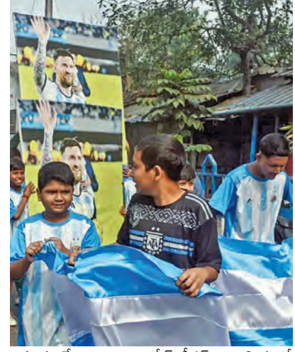
వక్రవ్రాసినా ఉన్నాయి. గోల్ కీపర్ ఎమిలియానో మార్సినిజో కూడా అందుబాటులో ఉండడం అర్జెంటీనాకు ఊరటనిచ్చే అంశం. మెస్సీని ఎంతవరకు

కాన్యాస్ సిటీ, జూన్ 16 సాకర్ ప్రపంచకప్ లో డిఫెండ్ చేసే అర్జెంటీనా తొలి పోరుకు సిద్ధమైంది. గ్రూప్-జెలో ఉన్న అర్జెంటీనా.. అల్బీరియాతో తలపడనుంది. భారత కాలమానం ప్రకారం బుధవారం ఉదయం ఆరున్నర గంటలకు మ్యాచ్ ప్రారంభం కానుంది. స్టార్ ఫైయర్ లియోనెల్ మెస్సీ చేసే మ్యాజిక్ కోసం ప్రపంచం మొత్తం ఆసక్తిగా ఎదురుచూస్తోంది. ప్రపంచ చాంపియన్ అర్జెంటీనా తన వరల్డ్ కప్ యాత్రను విజయంతో ప్రారంభించాలని చూస్తున్నాడు.. చరిత్ర సృష్టించే అవకాశాన్ని అందిస్తున్న కోపాలని అందర్నీ అల్బీరియా ఆశిస్తోంది. మెస్సీ మూయాజాలం, మహాజో ప్రతిభ మధ్య జరిగే ఈ పోరు ఉత్సాహం రేపుతోంది.