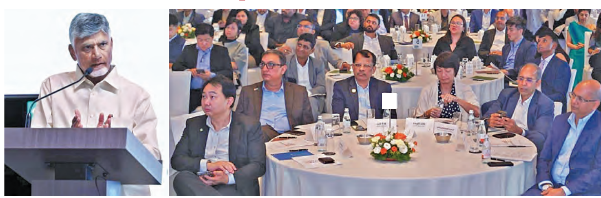
మంగళవారం సింగపూర్ లో సిఐఐ పార్ట్ నెట్ వర్క్ సదస్సులో మాట్లాడుతున్న సిఎం చంద్రబాబు. హాజరైన పారిశ్రామికవేత్తలు

స్పీడ్ ఆఫ్ డూయింగ్ బిజినెస్ లో ఎపిదే పేటెంట్ గ్రీన్ రాజధానిగా అమరావతి అభివృద్ధి అమరావతిని అడ్రస్ గా మార్చుకోండి సింగపూర్ పారిశ్రామికవేత్తలకు సిఎం చంద్రబాబు పిలుపు సిఐఐ సర్టిఫైడ్ సమ్మిట్ లో ప్రసంగించిన సిఎం