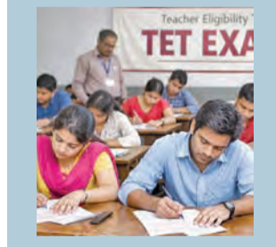
హైదరాబాద్, ప్రభాతవార్త, జూన్ 16: తెలంగాణ రాష్ట్రంలో టీవర్ ఎలిజిబిలిటీ టెస్ట్ (టిఎట్)-2026 పరీక్షలకు మంగళవారం నుంచి ప్రశాంతంగా ప్రారంభమయ్యాయి. మొదటి రోజు పరీక్షలు 72.99 శాతం హాజరీ నట్లు టెట్-2026 కన్నీసర్ జి రమేష్ ఒక ప్రకటనలో తెలిపారు. ఈనెల 22 వరకు పరీక్షలు కొనసాగుతున్నాయి. పరీక్షలను 5 రోజులపాటు 10 సెషన్లలో నిర్వహించనున్నారు. >>2

నెలాఖరున రైతు భరోసా ఏడున్నర ఎకరాలకే పరిమితం హైదరాబాద్, జూన్ 16, ప్రభాతవార్త: రైతులకు రాష్ట్ర ప్రభుత్వం తీసి కలుపు అందించింది. ఈ ఖరీఫ్ సీజన్ కు సంబంధించి ఎకరానికి రూ.6 వేల రైతు భరోసా నిధులను ఈ నెలా ఖరీఫ్ లోగా విడుదల >>2