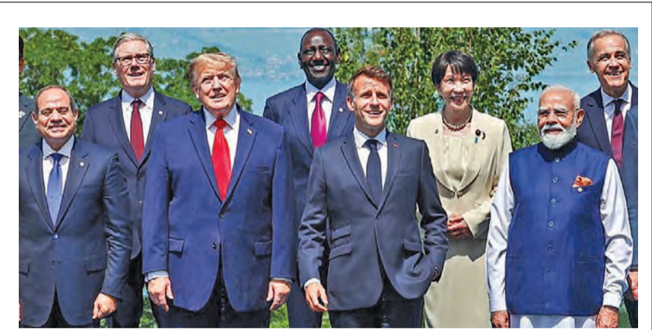
మంగళవారం ప్రాన్స్ లోని ఎవియన్ లో జరుగుతున్న జీ7 సదస్సులో ప్రధాని మోడీ, అమెరికా అధ్యక్షుడు ట్రంప్, ప్రాన్స్ అధ్యక్షుడు మేక్రాన్ తదితర దేశాధినేతలు