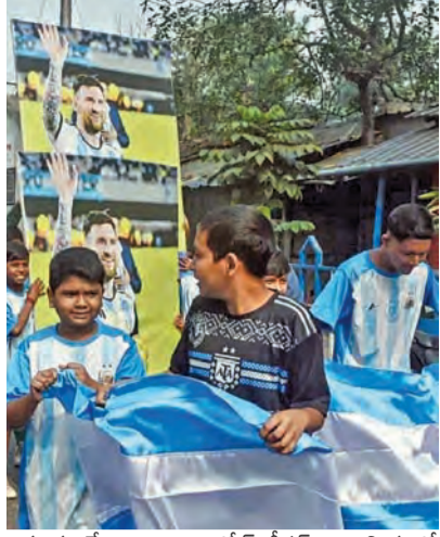
ఎక్కువగానే ఉన్నాయి. గోల్ కీపర్ ఎమిలియానో మార్షినెజ్ కూడా అందుబాటులో ఉండడం అర్జెంటీనాకు ఊరటనిచ్చే అంశం. మెస్సీని ఎంతవరకు

నిలువరిస్తారన్న అంశంపైనే అల్టిరియా విజయావకాశాలు ఉంటాయి. ద్రాగా ముగింపినా గొప్పగానే భావించవచ్చు. అయితే ప్రత్యర్థిని తక్కువ అంచనా వేయకూడదని అర్జెంటీనా కోచ్ లియోనెల్ స్కలారీ హెచ్చరిస్తున్నాడు. 2022 ప్రపంచకప్ తొలి మ్యాచ్ లో ఎదురైన అనుభవాన్ని గుర్తుచేస్తే... అల్టిరియా నైపుణ్యమైన జట్టుని పేర్కొన్నాడు. రియోట్ ముహ్లాజ్ నాయకత్వంలోని అల్టిరియా మెరుపు దాడులతో ప్రమాదకరంగా మారే అవకాశం ఉందని ఆటగాళ్లకు కోచ్ స్కలారీని సూచించాడు.