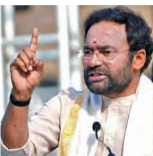
మంగళవారం మాట్లాడుతున్న కిషన్ రెడ్డి

హైదరాబాద్, జూన్ 16 ప్రభాతవార్త: ముఖ్యమంత్రి రేవంత్ రెడ్డి గత కార్యక్రమాల బాగా జరగాలనే కోరుకున్నాను తప్ప ఏనాడూ అడ్డుకునే కొన్నిరోజులు మెట్లో ప్రాజెక్టు విషయంలో అనేక రకాలుగా తన మీద ప్రయత్నం చేయలేదు. సిఎం రేవంత్ రెడ్డి సోమవారం మాట్లాడుతూ ఆత్మీయ ఆరోపణలు చేస్తున్నారని, గత ఏడేళ్లుగా కేంద్ర సహాయమంత్రిగా, కేబినెట్ మంత్రిగా తాను తెలంగాణ ప్రయోజనాల కోసం పనిచేసినా కేంద్ర మంత్రి కిషన్ రెడ్డి అన్నారు. మంగళవారం న్యూఢిల్లీలో కేంద్ర మంత్రి మీడియాతో మాట్లాడారు. తెలంగాణ అభివృద్ధి >>2