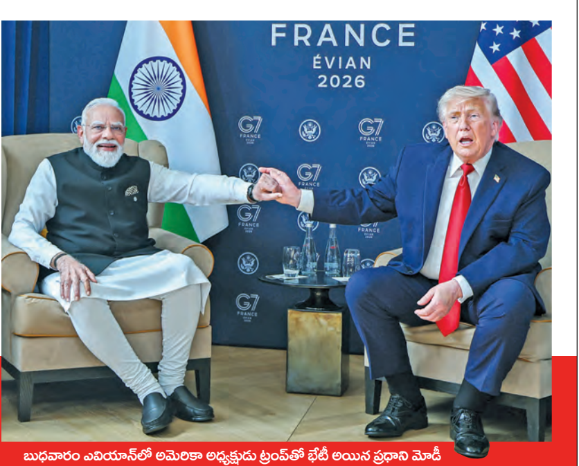
బుధవారం అవియన్ లో అమెరికా అధ్యక్షుడు ట్రంప్ తో భేటీ అయిన ప్రధాని మోడీ