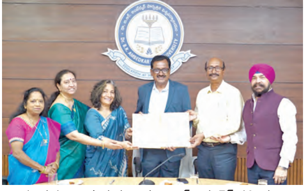
బుధవారం పత్రాల మార్పుకు సంబంధించి ఐసీఎఫ్ ప్రతినిధులు, అంబేద్కర్ వర్గీ ఏ ఆచార్యులు.