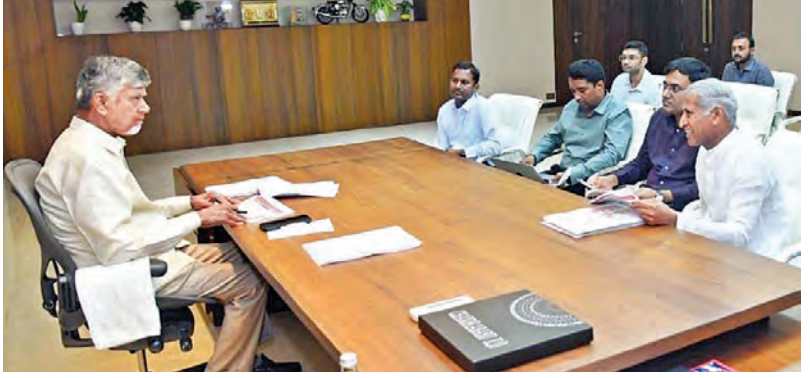
బుధవారం ఎపి సచివాలయంలో యోగాంధ్ర పై సమీక్షను ఎపి సీఎం చంద్రబాబు

ధ్వజమెత్తారు. జిల్లాకు చెందిన ముగ్గురు మంత్రులు మొనగాళ్లు కాదని మోనగాళ్లని అన్నారు. పాంగులేటి బాంబులెటి అని, ఆయన అవినీతి సామ్రాజ్యం వండలం, వేల కోట్ల పెరిగిపోయిందని పొంగులేటి కి సంబంధించిన వీడియోను, ఈ వీడియోను పాలేరు కేటీఆర్ ప్రదర్శించారు. ఈ వీడియోను పాలేరు నియోజకవర్గం లోని ప్రతి ఉంటికి చేర్చాలని కేటీఆర్ పిలుపునిచ్చారు. ఈ వీడియోను అప్పీయంట్ బిఆర్ఎస్ కేటీఆర్ ప్రదర్శించారు. తెలంగాణలో సుమారు కోటి ఎకరాల భూములను లిటిగేషన్లో ఉంచి వారి యజమానులను తన దగ్గరికి పిలిపించుకొని 20 నుండి 30 శాతం భూములను పొంగులేటి తాక్కుంటున్నారని కేటీఆర్ ఆరోపించారు. అదేవిధంగా రాష్ట్రంలో బీసీ మంత్రులు, ఇతర ఎమ్మెల్యేల హామీల పొంగులేటి కి క్యూతున్నారని, ములుగు జిల్లాలో 12 వేల క్యూటీటీ మిలర్ల బియ్యం రాక్కున్నారు. సమ్మర్ల, సార్కర్ల బెండర్ల విషయంలో ఆ జిల్లాకు చెందిన మంత్రులను జైలులో ఉంచిన కేటీఆర్ తీవ్రస్థాయిలో విరుగుతున్నారని, కలెక్టర్లను పైతాపైతా తన అని సెన్స్ లేకుండా మాట్లాడుతున్నారని అన్నారు. పాలేరులో 20 లక్షల ఇండ్లు కట్టి ఓట్లు అడుగుతానని లెవండే రాజీయాల నుంచి తప్పుకుంటానని చెప్పిన పొంగులేటి ఆ మాటపై నిలబడాలని, దమ్ము, ధైర్యం ఉంటే 20 లక్షల ఇండ్లు కట్టి చూపించాలని కేటీఆర్ డిమాండ్ చేశారు.