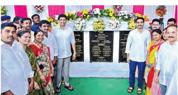
బుధవారం నిడమర్రు ఆరోగ్య శివాలయంలో ఆరోగ్య శివాలయం తదితర పనుల ప్రారంభ కార్యక్రమంలో భాగంగా శిలా ఫలకాలను ఆవిష్కరించిన ఎపి మంత్రి లోకేశ్, కేంద్రమంత్రి పెమ్మసాని చంద్రశేఖర్