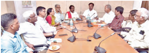
కార్యక్రమంలో పాల్గొన్న సీఎం నేత జాన్సెట్టి, సీపీఎ నేతలు

ప్రభాతవార్త ప్రాంత ప్రతినిధి, హైదరాబాద్, జూన్ 17: గురువారం ఉదయం 11.30 గంటలకు సచివాలయంలో అసెంబ్లీ కేబినెట్ ఫోజీ జరగనున్నట్లుగా సమాచారం. పలు అంశాలపై సీఎం రేవంత్ రెడ్డి, మంత్రులు సమాలోచనలు జరపనున్నారు. రైతుభరోసా, కేంద్రంపై ఒత్తిడి అలశాలు, రాజకీయ పరిస్థితులపై చర్చించే అవకాశం ఉంది. తెలంగాణలో భారీగా పెన్షన్లు రద్దు అయ్యాయి. ఈ నెల 26 నుంచి రైతు భరోసా నిధులు రైతుల భారీగా వేసేందుకు ప్రభుత్వం సన్నద్ధమైందని సమాచారం. ఈసారి 9 రోజుల్లో రైతు భరోసా ప్రక్రియను పూర్తి చేయించడం తెలుస్తోంది. ఏకంగా 1.28 లక్షల పెన్షన్లు అధికారులు రద్దు చేశారు. అసర్లును గుర్తించే ప్రక్రియలో భాగంగా ఈ నిర్ణయం తీసుకున్నారు. రకరకాల కారణాలతో పెన్షన్ లబ్ధిదారుల జాబితా నుంచి అసర్లును ఏర్పేశారు. అదే సమయంలో కొత్త పెన్షన్లు జారీ చేసేందుకు లబ్ధిదారులను కూడా గుర్తించారు. ఈ క్రమంలోనే 48 వేల మందికి కొత్త పింఛన్లు అందించనున్నారు.