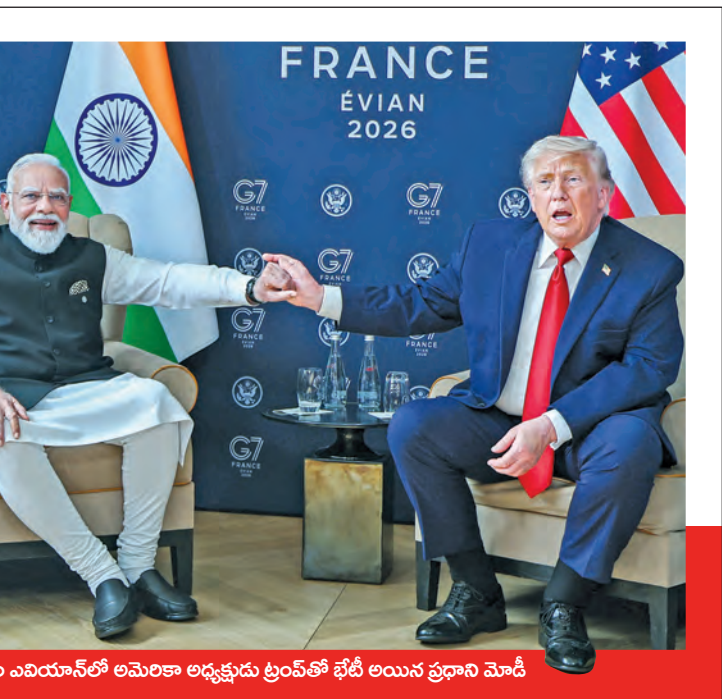
బుధవారం ఎవియాన్లో అమెరికా అధ్యక్షుడు ట్రంప్ తో భేటీ అయిన ప్రధాని మోడీ

మోడీ మాకు ఆప్త మిత్రుడు.. త్వరలోనే భారత్ కు వస్తా నావికుల భద్రత భారత్ కు కీలకమన్న మోడీ హర్యాణా తెరవడం ప్రపంచ ఆర్థిక వ్యవస్థకు కీలకం పశ్చిమాసియా శాంతికి కృషి చేసిన ట్రంప్ కు ప్రధాని మోడీ ప్రశంసలు