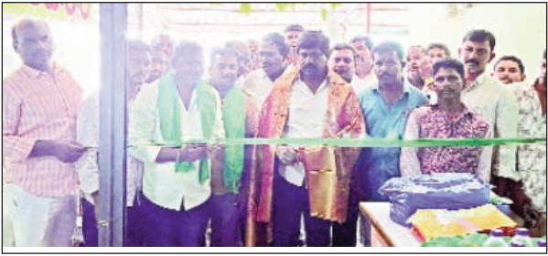
నకిరెకల్ నియోజకవర్గ పరిధిలోని కట్టంగూర్ మండల కేంద్రంలో