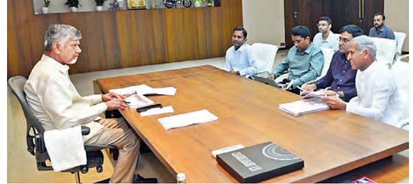
బుధవారం సచివాలయంలో యోగాంధ్రుల సమీక్షను సిఎం చంద్రబాబు

21న రాష్ట్ర వ్యాప్త సమన్వయంతో యోగా దినోత్సవం కార్యక్రమాన్ని ప్రజా ఉద్యమంగా మార్చాలి ఇందిరాగాంధీ మున్సిపల్ స్టేడియంలో ఘనంగా నిర్వహణకు ఏర్పాట్లు ఇప్పటిదాకా 2.6 లక్షల మందికి శిక్షణ ఉన్నత స్థాయి సమీక్షలో సిఎం చంద్రబాబు