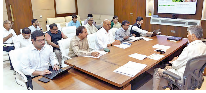
చేనేత కార్మికులు, కళాకారుల ప్రతిభను గుర్తించి ప్రోత్సహించేందుకు రాష్ట్ర స్థాయి చేనేత పురస్కారాలివ్వాలని వైఎస్ఆర్ అధ్యక్ష మంత్రి సత్యకుమార్ యాదవ్ గౌరవ ముఖ్య మంత్రి నారా చంద్రబాబు నాయుడుకు విజ్ఞప్తి చేశారు.