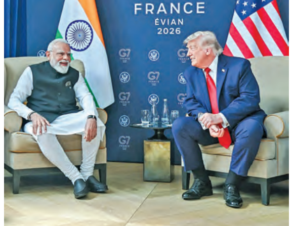
గురువారం ఫ్రాన్స్ లోని ఎవియన్ లో భోజి అయిన ప్రధాని మోడీ, యుఎస్ ప్రెసిడెంట్ డొనాల్డ్ ట్రంప్

ప్రధాని మోడీతో ద్వైపాక్షిక చర్చల్లో ప్రకటించిన యుఎస్ అధ్యక్షుడు ట్రంప్ మోడీ మాకు ఆప్తమిత్రుడు.. త్వరలోనే భారత్ వస్తా నావికుల భద్రత భారత్ కు కీలకమన్న ప్రధాని మోడీ హార్డుకోను తెరవడం ప్రపంచ ఆర్థిక వ్యవస్థకు కీలకం పశ్చిమాసియా శాంతికి కృషి చేసిన ట్రంప్ కు మోడీ ప్రశంసలు