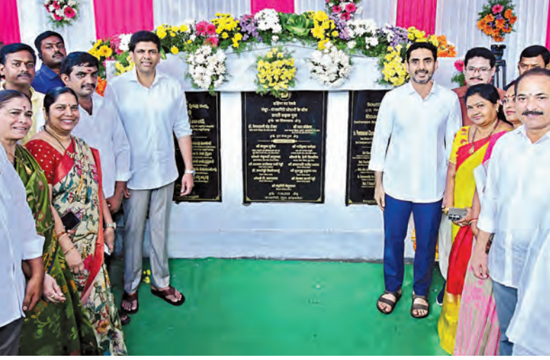
బుధవారం నిడమర్ర ఆరోజీ నిర్మాణం తదితర పనుల ప్రారంభ కార్యక్రమంలో భాగంగా శిలా ఫలాలను అభివృద్ధిచిన మంత్రి లోకేష్, కేంద్రమంత్రి పెమ్మసాని చంద్రశేఖర్