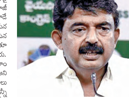
దర్యాప్తు చేయించాల్సిందేనని అన్నారు. విజయవాడలో