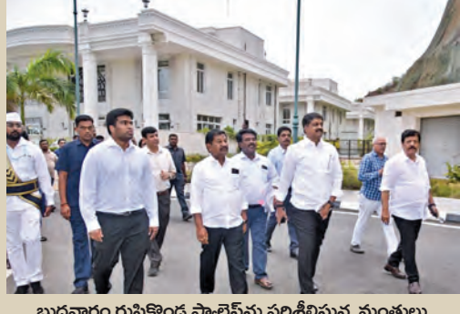
బుధవారం రుషికొండ ప్యాలెస్ ను పరిశీలిస్తున్న మంత్రులు

లగ్జరీ రిసార్ట్ గా మార్చే యోచన, ప్రజల సందర్శనార్థం హెలికాప్టర్ సెంటర్ ప్రతిపాదన రుషికొండ భవనాలను పరిశీలించిన కేబినెట్ సభ కమిటీ