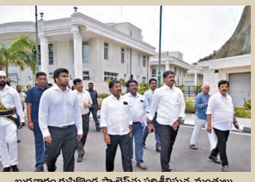
బుధవారం రుషికొండ ప్యాలెస్ ను పరిశీలిస్తున్న మంత్రులు

లగ్జరీ రిసార్ట్ గా మార్చే యోచన, ప్రజల సందర్శనార్థం హెలికాప్టర్ సెంటర్ ప్రతిపాదన రుషికొండ భవనాలను పరిశీలించిన కేబినెట్ సబ్ కమిటీ