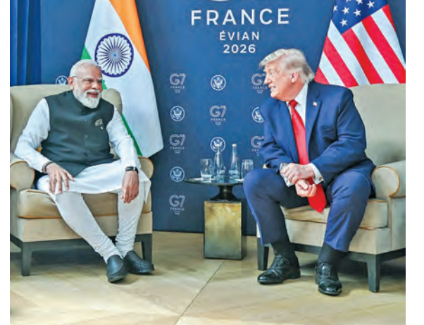
గురువారం ఫ్రాన్స్ లోని ఎవియాన్ లో భేటీ అయిన ప్రధాని మోడీ, యుఎస్ ప్రెసిడెంట్ డొనాల్డ్ ట్రంప్

ప్రధాని మోడీతో డైరెక్ట్ ట్రేడ్ చర్చల్లో ప్రకటించిన యుఎస్ అధ్యక్షుడు ట్రంప్ మోడీ మాకు ఆప్తమిత్రుడు.. త్వరలోనే భారత్ వస్తా నావికుల భద్రత భారత్ కు కీలకమన్న ప్రధాని మోడీ హార్టుజీను తెరవడం ప్రపంచ ఆర్థిక వ్యవస్థకు కీలకం పశ్చిమాసియా శాంతికి కృషి చేసిన ట్రంప్ కు మోడీ ప్రశంసలు