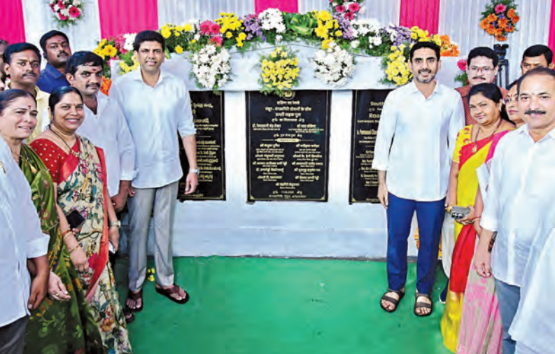
బుధవారం నిడమర్రు ఆరోగ్య నిర్మాణం తదితర పనుల ప్రారంభ కార్యక్రమంలో భాగంగా శిలా ఫలకాలను అవిష్కరించిన మంత్రి లోకేశ్, కేంద్రమంత్రి పెమ్మసాని చంద్రశేఖర్