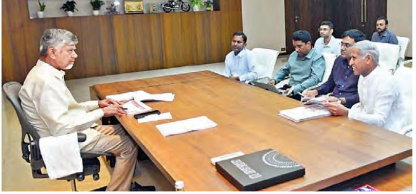
బుధవారం సచివాలయంలో యోగాంధ్రప్రస్థ సమీక్షిస్తున్న సిఎం చంద్రబాబు

21న రాష్ట్ర వ్యాప్త సమన్వయంతో యోగా దినోత్సవం కార్యక్రమాన్ని ప్రజా ఉద్యమంగా మార్చాలి ఇందిరాగాంధీ మున్సిపల్ స్టేడియంలో ఘనంగా నిర్వహణకు ఏర్పాట్లు ఇప్పటిదాకా 2.6 లక్షల మందికి శిక్షణ ఉన్నత స్థాయి సమీక్షలో సిఎం చంద్రబాబు