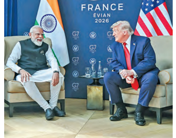
గురువారం ఫ్రాన్స్ లోని ఎవియాన్ లో భేటీ అయిన ప్రధాని మోడీ, యుఎస్ ప్రెసిడెంట్ డొనాల్డ్ ట్రంప్

ప్రధాని మోడీతో డైరెక్ట్ ట్రెడ్ లో ప్రకటించిన యుఎస్ అధ్యక్షుడు ట్రంప్ మోడీ మాకు ఆప్తమిత్రుడు.. త్వరలోనే భారత్ వస్తా నావికుల భద్రత భారత్ కు కీలకమన్న ప్రధాని మోడీ హార్టుజీను తెరవడం ప్రపంచ ఆర్థిక వ్యవస్థకు కీలకం పశ్చిమాసియా శాంతికి కృషి చేసిన ట్రంప్ కు మోడీ ప్రశంసలు