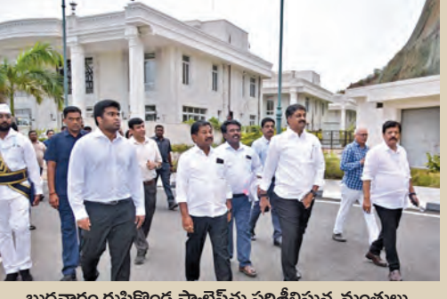
బుధవారం రుషికొండ ప్యాలెస్ ను పరిశీలిస్తున్న మంత్రులు

లగ్జరీ రిసార్ట్ గా మార్చే యోచన, ప్రజల సందర్శనార్థం హెలికాప్టర్ సింటర్ ప్రతిపాదన రుషికొండ భవనాలను పరిశీలించిన కేబినెట్ సబ్ కమిటీ