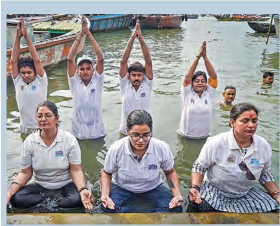
వారణాసిలో గురువారం గంగానదీలో 'జల యోగ' సాధన చేస్తున్న సమాజి గంగ కట్టలు