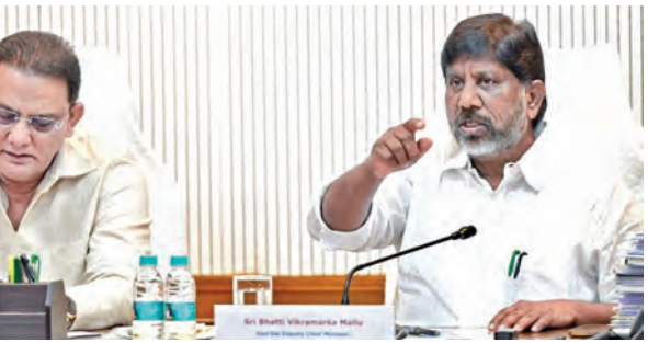
మైనార్టీల సమీక్షలో మాట్లాడుతున్న డి.సి.ఎం భట్టి. చిత్రంలో మంత్రి అజారుద్దీన్

అసంపూర్ణా ఉన్న గురుకులాలపై ప్రత్యేక దృష్టి క్రిష్టియన్ మైనార్టీల సంక్షేమానికి రూ.50 కోట్లు డిప్యూటీ సి.ఎం భట్టి విక్రమార్క హైదరాబాద్, జూన్ 18, ప్రభాతవార్త: రాష్ట్రంలోని మైనార్టీల సామాజిక, ఆర్థిక, విద్యావిస్తృతికి తమ ప్రభుత్వం పూర్తిగా కట్టుబడి ఉందని డిప్యూటీ సి.ఎం భట్టి విక్రమార్క స్పష్టం చేశారు. ఇందుకోసం బడ్జెట్ లో భారీగా నిధులను కేటాయించామని, వాటికి సంబంధించిన అభివృద్ధి పనులను యుద్ధప్రాతిపదికన వేగవంతం చేస్తున్నామని తెలిపారు. హైదరాబాద్ లోని సచివాలయంలో గురువారం మైనార్టీల సంక్షేమం, వివిధ అభివృద్ధి పనుల