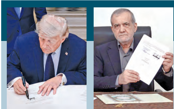
ఒప్పందంపై ట్రంప్ సంతకం ట్రంప్ కిరీస్తున్న పెజెక్వియాన్