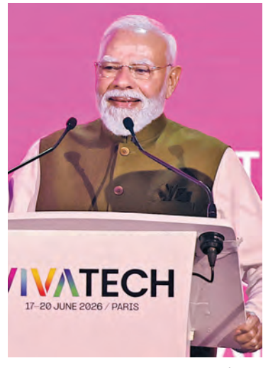
వివాటిక సదస్సులో ప్రధాని మోడీ

వివాటిక సదస్సులో ప్రధాని మోడీ పారిస్, జూన్ 18: ఫ్రాన్స్ లో నిర్వహించిన వివాటిక 10వ ఎడిషన్ కార్యక్రమంలో పాల్గొని ప్రసంగించిన ప్రధాని మోడీ యూరప్ లోనే అతిపెద్ద టెక్నాలజీ ఈవెంట్. ఈ కార్యక్రమం విజయవంతం కావడంలో అధ్యక్షుడు మాక్రొన్, నిర్వాహకుల కృషి అభినందనీయుమని అన్నారు. అలాగే 2026 సంవత్సరం భారత్ యూరప్ సంబంధాలకు ప్రత్యేక ప్రాధాన్యత కలిగిన ఏడాదిగా నిలిచిందని పేర్కొన్నారు. ఈ ఏడాది ప్రారంభంలో భారత్ యూరప్ పీఠం యూనియన్ మధ్య చారిత్రాత్మక స్వేచ్ఛా వాణిజ్య ఒప్పందం కుదిరింది. ఈ ఒప్పందం వాణిజ్యం, పెట్టుబడులను మరింత విస్తరించడమే కాకుండా ప్రతిభ, సాంకేతికత, పర్యాటక రంగాల్లో పరస్పర సహకారానికి కొత్త అవకాశాలను తెరుస్తుందని మోడీ వెల్లడించారు. అదేవిధంగా, ఇండియా ఫ్రాన్స్ ఇయర్ ఆఫ్ ఇన్వెస్ట్ మెంట్ ప్రారంభంలో భారత్, యూరప్ టెక్నాలజీ ఎకో సిస్టమ్ మధ్య సంబంధాలు మరింత బలోపేతం అవుతున్నాయని చెప్పారు. ఈ ఏడాది