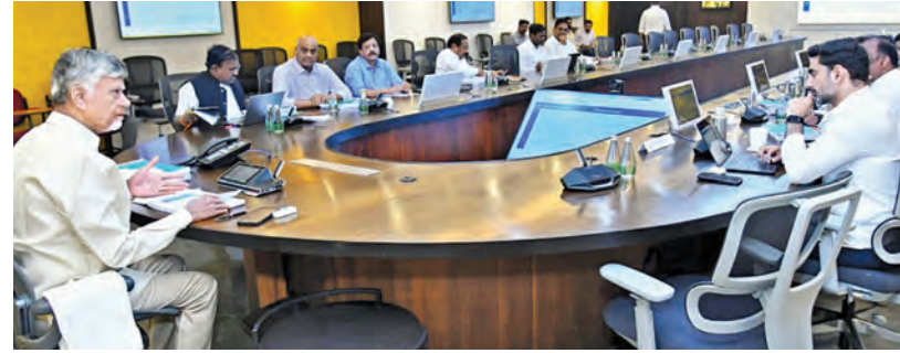
గురువారం సచివాలయంలో ఎన్ఐపిబి సమావేశంలో పాల్గొన్న సిఎం చంద్రబాబు

విజయవాడ, జూన్ 18 ప్రభాతవార్త ప్రతినిధి: పారిశ్రామికాభివృద్ధి ఫలాలు పేద, మధ్య తరగతి ప్రజలకు అందేలా చూడాలని ముఖ్యమంత్రి నారా చంద్రబాబునాయుడు ఆదేశించారు. ఈ మేరకు ఏపీలో ఏర్పాటు చేసిన పారిశ్రామిక ఎఫ్ సిస్టం రూపొందించాలని సిఎం స్పష్టం చేశారు. పరిశ్రమలు, కంపెనీలను ధనికులే స్వాధీనం చేసుకోవడం భావన పోయేలా అధికారులు చొరవ తీసుకోవాలని సూచించారు. గురువారం రాష్ట్ర సచివాలయంలో సిఎం చంద్రబాబు నేతృత్వంలో 18వ ఎన్ఐపిబి సమావేశం జరిగింది. ఈ సమావేశంలో వివిధ కంపెనీల ఏర్పాటుకు అనుమతులిచ్చారు. మొత్తంగా 50 కంపెనీలకు సంబంధించి రూ.30,515 కోట్ల పెట్టుబడులకు ఎన్ఐపిబి ఆమోదం తెలిపింది. ఈ