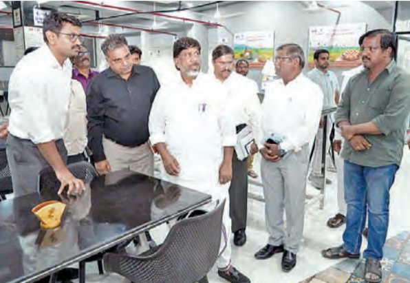
హైదరాబాద్, జూన్ 16, ప్రభాతవార్త: దక్షిణ తెలంగాణ విద్యుత్ పంపిణీ సంస్థ (టిజీఎస్పీడీసీఎల్) పధాన కార్యాలయ అవరణలో ఉద్యోగుల సౌకర్య ర్థం సూతనంగా ఏర్పాటు చేసిన మహిళా శక్తి క్యాంటీన్ ను డిప్యూటీ సీఎం భట్టి విక్రమార్జున పరిశీలించారు. క్యాంటీన్ ఏర్పాటుకు అయిన మొత్తం ఖర్చు,

మితమైన, బలమైన ఎల్ నీనో పరిస్థితులు ఉంటాయని తాళా అంచనాలు సూచిస్తున్నాయి. కాగా హిందూ మహాసముద్రంలో పాజిటివ్ ఐఓడి ఏర్పడే అవకాశాలు ఉన్నాయి. ఇదే నిజమైతే, పసిఫిక్ లో మునుపొక్కన్న ఈ సూపర్ ఎల్ నీనో స్పష్టంబోయే విధ్వంసాన్ని, నష్టాన్ని పాజిటివ్ ఐఓడి కొంతవరకు అడ్డుకుని, భారతదేశానికి రక్షణ కవచంగా మారే అవకాశం ఉందని వాతావరణ నిపుణులు ఆశాభావం వ్యక్తం చేస్తున్నారు. జూలైలో సానుకూల ఐఓడి ఏర్పడే అవకాశం ఉందని, ఇది దేశంలోని రుతుపవన వర్షపాతంపై సూపర్ ఎల్ నీనో చూపే ప్రతికూల ప్రభావాలను కొంతవరకు తగ్గించడంలో సహాయపడవచ్చని పేర్కొంది. రాబోయే కాలంలో పసిఫిక్, హిందూ మహాసముద్రాలలో మారబోయే ఈ వాతావరణ పరిస్థితులను నిరంతరం నిశితంగా గమనిస్తూ, ప్రతి నెలా అవేడెట్స్ ఇస్తామని భారత వాతావరణ శాఖ దేశ ప్రజలకు, రైతులకు భరోసా ఇస్తుంది.