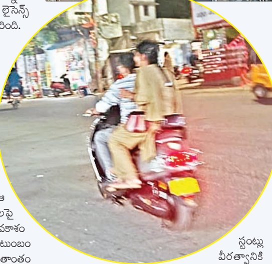
స్టంట్లు వీరత్వానికి గుర్తులు కావు. అవి

18 సంవత్సరాలు నిండిన వారికే వాహనం నడిపే అర్హత ఉంటుంది. లైసెన్స్ లేకుండా వాహనం నడపడం నేరం. మైనర్ వాహనం నడిపి ప్రమాదానికి కారణమైతే వాహన యజమానిపై కేసు నమోదు చేస్తారు. రూ. 25 వేల వరకు జరిమానా విధించే అవకాశం ఉంది. వాహన రిజిస్ట్రేషన్ రద్దు చేయవచ్చు. తల్లిదండ్రులకు లేదా వాహనం ఇచ్చిన వ్యక్తికి జైలు శిక్ష వడే అవకాశం ఉంది. ప్రమాదంలో ప్రాణనష్టం జరిగితే మరింత కఠిన చర్యలు ఎదుర్కోవాల్సి ఉంటుంది. పోలీసులు ప్రత్యేక నిఘా ఏర్పాటు చేయాలి. ప్రజల అభిప్రాయం ప్రకారం ఇల్లందు పట్టణంలోని ప్రధాన కూడళ్లు, పాఠశాలలు, కళాశాలల వద్ద ప్రత్యేక తనిఖీలు నిర్వహించాలి. మైనర్ డ్రైవింగ్పై ప్రత్యేక డ్రైవ్ చేపట్టి వాహనాలను స్వాధీనం చేసుకోవాలి. ట్రాఫిక్ అవగాహన కార్యక్రమాలను విస్తృతంగా నిర్వహించి విద్యార్థులు, తల్లిదండ్రులకు చట్టాలపై అవగాహన కల్పించాలి. అలాగే ప్రధాన రహదారులపై అవసరమైన చోట్ల స్పీడ్ బ్రేకర్లు ఏర్పాటు చేసి అతివేగాన్ని నియంత్రించాలని ప్రజలు