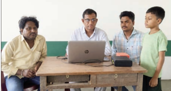
మాట్లాడుతూ విద్యార్థులు తల్లిదండ్రులు ఈ సేవలను వినియోగించుకొని ఆధార్ కు సంబంధించిన సమస్యలను సులభంగా పరిష్కరించుకోవచ్చని తెలిపారు. కార్యక్రమంలో ఉపాధ్యాయులు సిబ్బంది గ్రామస్థులు పాల్గొన్నారు.