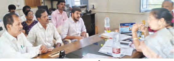
మాట్లాడుతున్న డిఆర్ఎస్ స్టాఫ్