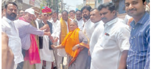
అభివృద్ధి పనులకు శంకుస్థాపన చేస్తున్న ప్రభుత్వ సలహాదారు వీహెచ్

బాగ్ అంబరపేట్ వెల్చేర్ సొసైటీ కాలనీ ప్రజలకు ఒక శుభవార్త. కాలనీలోని 900 చదరపు గజాల భూమి స్థలాన్ని