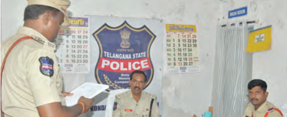
కొడంగల్ పోలీస్ స్టేషన్లో తనిఖీకి వచ్చిన డిఎస్పీ