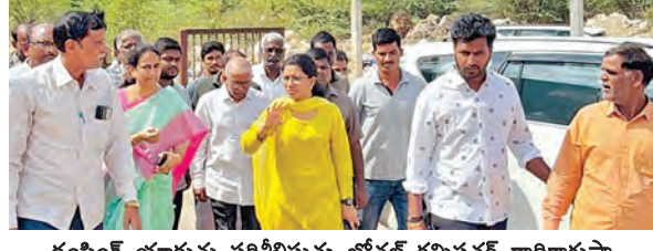
డంపింగ్ యార్డును పరిశీలిస్తున్న జోనల్ కమిషనర్ రాధికాగృప్తా