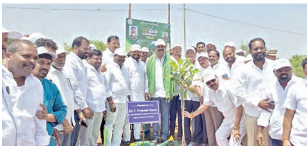
మొక్కలు నాటుతున్న ఎమ్మెల్యే ప్రకాష్ గౌడ్