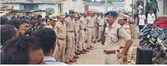
అవగాహన కల్పిస్తున్న డిఎస్పీ శ్రీనివాస్

45 ద్విచక్ర వాహనాలు, 3 ఆటోలు సీజ్ వరిగి, జూన్ 18, ప్రభాతవార్త : అసాఫీక కార్యకలాపాల నివారణకు, శాంతి భద్రతలకు విఘాతం కలగకుండా కార్యన సెర్చ్ తో పోలీసులు అధికారులు ముమ్మర తనిఖీలు చేపట్టారు. గురువారం, విశాఖజిల్లా జిల్లా పరిగి మండలం మల్లెమోనిగూడలో విశాఖజిల్లా జిల్లా ఎన్టీ స్టేషన్ మేడ్రా, ఆదేశాల మేరకు పరిగి డివిజన్ పరిధిలో డిఎస్పీ శ్రీనివాస్ నేతృత్వంలో ముమ్మర తనిఖీలు చేపట్టారు. సోమవారం తెల్లవారుజామున ఉ.5గం నుండి డిఎస్పీ శ్రీనివాస్ ప్రత్యేక పర్యవేక్షణలో భారీ కమ్యూనిటీ కాంట్రోల్ (కార్యన ఆండ్ సెర్చ్) ఆపరేషన్ నిర్వహించారు. గ్రామంలోని ప్రతి ఇంటిని, పరిసరాలలో విస్తృత తనిఖీలు చేపట్టారు. సరైన పత్రాలు లేని 45 ద్విచక్ర వాహనాలు, 3 ఆటోలు, 1 కారుతో పాటు, నిబంధనలకు విరుద్ధంగా నిల్వ ఉంచిన 39 లీటర్ల అక్రమ మద్యాన్ని పోలీసులు స్వాధీనం చేసుకున్నారు. ట్రాఫిక్ నిబంధనలు ఉల్లంఘించిన వారిపై 31 చలాన్లు నమోదు చేసి, రూ. 12,245/- జరిమానా విధించారు. సెర్చ్ లో భాగంగా వలుపు అనుమానిత వ్యక్తులకు పాపీ లాన్ డివైస్ చార్జీ తనిఖీలు చేశారు. డిఎస్పీ మాట్లాడుతూ, గ్రామంలో ఎలాంటి అసాఫీక కార్యకలాపాలూ జరగకుండా భద్రత వహించాలని, శాంతిభద్రతలకు విఘాతం కలగనీ కఠినపర్యలు తప్పనిసీ హెచ్చరించారు. దాదాపు 160 పైగా పోలీసు బలగాలతో సెర్చ్ ఆపరేషన్ నిర్వహించారు. గ్రామ ప్రజలతో ప్రత్యేకంగా