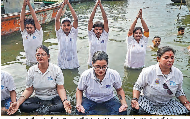
వారణాసిలో అంతర్జాతీయ యోగా దినోత్సవం సందర్భంగా గురువారం సమాఖ్య గంగ సభ్యులు గంగానదిలో 'జలయోగా' చేస్తున్న దృశ్యం

ఉమ్మడి తూర్పుగోదావరి జిల్లా ప్రతినిధి, జూన్ 18(ప్రభాతవార్త): ప్రధాని మోడీ చలువ సిఎం చంద్రబాబు చొరవ తోనే రాష్ట్రానికి రెండేళ్లలోనే ఎన్నడు లేని విధంగా 10 లక్షల కోట్ల రూపాయలు నిధులు వచ్చాయని బిజెపి రాష్ట్ర అధ్యక్షుడు మాధవ్ స్పష్టం చేశారు.తూర్పుగోదావరి జిల్లా రాజమహేంద్రవరంలో బిజెపి అధ్యక్షుడు మాధవ్ పర్యటించారు. పోస్టు శాఖ ద్వారా ప్రవేశపెట్టిన పథకాల సమూహ స్టాల్ ప్రారంభించారు. ఈ సందర్భంగా ఆయన మాట్లాడుతూ పోలవరం ప్రాజెక్టులు కేంద్రం 35 వేల కోట్ల రూపాయలు ఇచ్చిందని, విశాఖ రైల్వే జోన్ ప్రధాని ప్రధాని సాధ్యం చేశారని గుర్తు చేశారు. జగన్, వర్షాల పారదూరక చేసి ఈ అభివృద్ధిని హానుకోవాలని ఎచ్చేలా చేశారు డీఎస్సీ బిల్డ్ పై అధికారులు వివరణ ఇచ్చిన జగన్ ప్రెస్ మెంట్ రాక్షులం చేస్తున్నారని విమర్శించారు. పేదల సంక్షేమానికి 160కోట్ల పథకాలను ప్రధాని మోడీ ప్రవేశపెట్టారన్నారు. పోస్ట్ లో డిపార్టుమెంట్ ద్వారా పొదుపు, డీమా పథకాలను ప్రవేశపెట్టారన్నారు. కేవలం రూ.7500 కెట్లెస్ట్ రూ.15లక్షల ప్రమాద డీమా కల్పించారని, డబుల్ అంజీన్ సర్కారు వల్ల రాష్ట్రానికి రూ.41 లక్షల కోట్లు పెట్టుబడులు వచ్చాయన్నారు. అమరావతి నిర్మాణానికి కేంద్రం రూ.30 వేల కోట్ల నిధులు ఇచ్చిందన్నారు. జగన్ మాతో వస్తే , మేం చేసిన అభివృద్ధి ఎంతో చూపిస్తామని మాధవ్ అన్నారు. ప్రస్తుతం, సెన్సెషన్ కోసమే జగన్ కొత్త పథకాలను విమర్శించారు. కుట్రమే ప్రభుత్వంలో డీఎస్సీ అత్యంత పారదర్శకంగా జరిగిందని మాధవ్ స్పష్టం చేశారు.