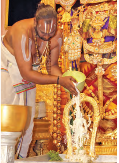
చనువారు. శ్రీవారి ఆలయంలో 24వతేదీ ఆర్చిత సేవలన్నీ యథావిధిగా నిర్వహించనున్నారు.

తిరుమల,జూన్ 18 ప్రభాతవార్తాప్రతినిధి: తిరుమల ఆలయంలోని శ్రీవారి వంద జేతలలో ఒకటైన భోగి శ్రీనివాసమూర్తికి ప్రత్యేకంగా నిర్వహించిన భోగి పురస్కారముకుని ఆలయంలో 24వ తేదీ ప్రత్యేక సమాప్తి కలశాభిషేకం నిర్వహించనున్నారు. తిరుమల ఆలయంలో వల్లవరాజీ సామనై కొన్ని వందల సంవత్సరాల కిందట ఈమూర్తిని కోలుపుచేసారు. 24వతేదీ ఉదయం శ్రీవారి ఆలయంలోని గరుడాశ్రాద్ధ సన్నిధిలో శ్రీదేవి, భూదేవి సమేతమలయపుస్వామి , భోగి శ్రీనివాసమూర్తి, విష్ణుకృష్ణ సులలిని వేసే వస్తువులు ఉన్నాయి. శ్రీవారి మూలమూర్తికి ముందు గరుడాశ్రాద్ధ సన్నిధిలో కొంతమూర్తి మనవాళ పెరు మాణిక్యభోగి శ్రీనివాసమూర్తిని, ఆయనకు అభిముఖంగా విష్ణుకృష్ణ సులలిని ఆశీస్సులు చేస్తారు. తర్వాత శ్రీవారి మూలమూర్తిని భోగి శ్రీనివాసమూర్తికి కలుపుతూ దారం కట్టి అనుసంధానం చేస్తారు. ఆనంతరం వేద పండితులు వేద పారాయణం చేయగా, అర్చకస్వాములు ప్రత్యేక సమాప్తి కలశాభిషేకాన్ని వైభవంగా నిర్వహించారు.