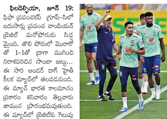
ఫిలడెల్ఫియా, జూన్ 19: ఫిఫా ప్రపంచకప్ గ్రూప్-సిలో ఐదుసార్లు ప్రపంచ చాంపియన్ బ్రెజిల్ మరోసారి సీడ్ల మైంది. తొలి పోరులో మొరాకో తో 1-1తో డ్రాగా ముగిచి నిరాశపరిచిన సాదా జట్టు...

ఈ సారి అండర్ డాగ్ హైతీ కీలక మ్యాచ్ లో తలపడనుంది. ఈ మ్యాచ్ భారత కాలమానం ప్రకారం శనివారం తెల్లవారు జామున ప్రారంభమవుతుంది. ఈ మ్యాచ్ లో బ్రెజిల్ కు గెలుపు తప్పనిసరి. లేదంటే నాకౌట్ అవకాశాలు క్షిప్రంగా మారతాయి. మరోవైపు స్వాట్జ్లాండ్ చేతిలో ఓడిన హైతీ... సంవలనం సృష్టించాలని ఆశిస్తోంది.