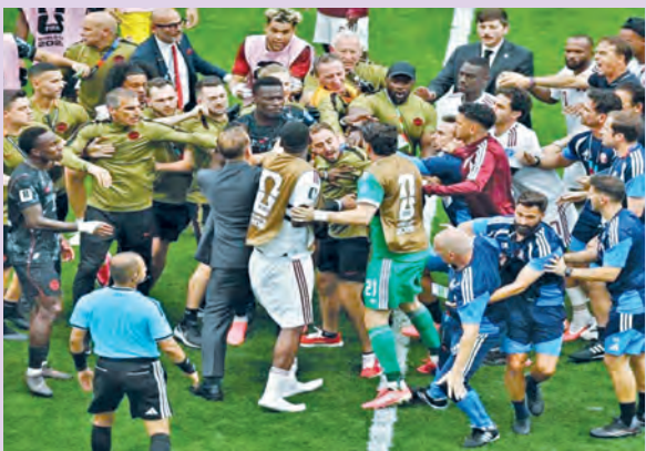
వాంకేవర్, జూన్ 18: ఫుట్ బాల్ గ్రౌండ్ లో బాక్సింగ్ రింగ్ గా మారింది. ఆటగాళ్ల ఒకరిపై ఒకరు ముష్టిపూతాలు చూపారు. ఇది సాకర్ వరల్డ్ కప్

లో చేటుచేసుకుంది. వాంకేవర్లో జరిగిన కెనడా, ఖతార్ మ్యాచ్లో ఇరు జట్ల ఆటగాళ్ల తమ్ముకోసం హాట్ టాపిక్ గా మారింది. మ్యాచ్ ముగియగానే కెనడా ఆటగాళ్ల ఖతార్ జట్టుపై దూసుకొచ్చారు. ఆటగాళ్ల ఒకరిపై ఒకరు దాడి చేసుకునేందుకు యత్నించారు. ఈ క్రమంలో మైదానంలోకి వచ్చిన భద్రతా సిబ్బంది... ఇరుజట్లను వేరు చేసి అక్కడినుంచి పంపించేశారు. ఈ సమయంలో మైదానంలో గండరగోళం నెలకొంది. దీనికి సంబంధించిన వీడియో వైరల్ గా మారింది.