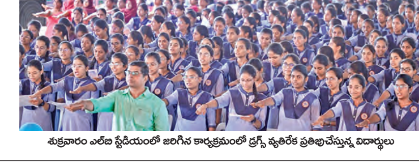
శుక్రవారం ఎల్ఐసీ యంత్రాంగంలో జరిగిన కార్యక్రమంలో డ్రగ్స్ వ్యతిరేక ప్రతిజ్ఞ చేస్తున్న విద్యార్థులు