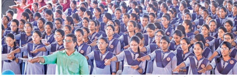
శుక్రవారం ఎల్ టీ డియోలో జరిగిన కార్యక్రమంలో డ్రగ్స్ వ్యతిరేక ప్రతిజ్ఞ చేస్తున్న విద్యార్థులు

ప్రభుత్వ పాఠశాలల్లో 'నో అడ్మిషన్' బోర్డులు పెట్టే పరిస్థితి విద్యాభివృద్ధికి రూ. 26,600 కోట్లు ఖర్చు ఈ రంగాన్ని నేనే స్వయంగా ప్రక్షాళన చేస్తున్నా బ్లూ కాలర్ జాబ్స్ వైపు దృష్టి సారించాం యంగ్ ఇండియా వెల్ కమ్ కిట్స్ పంపిణీ, డ్రగ్స్ వ్యతిరేక ప్రతిజ్ఞలో సిఎం రేవంత్