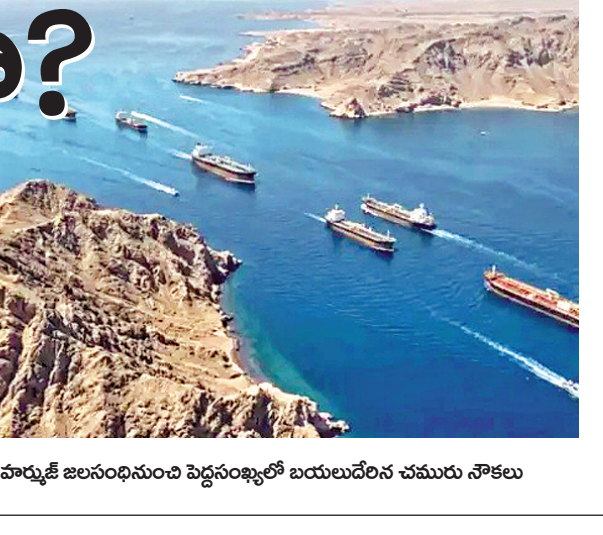
హార్సుక్ జలసంధి నుంచి దివ్యసంఖ్యలో బయలుదేరిన చమురు నౌకలు