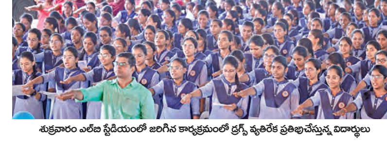
శుక్రవారం ఎల్ఐసీ స్టేడియంలో జరిగిన కార్యక్రమంలో డ్రగ్స్ వ్యతిరేక ప్రతిజ్ఞ చేస్తున్న విద్యార్థులు