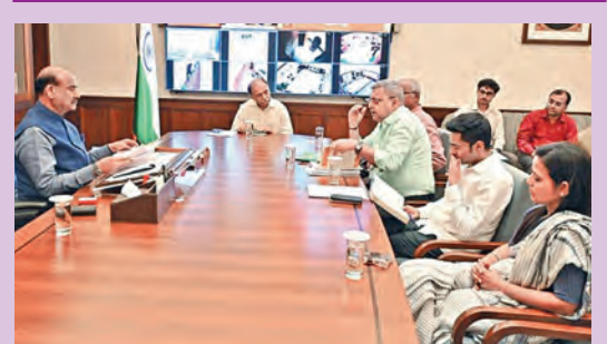
శుక్రవారం స్వీకర్ ఓంబ్రాతో భేటీ అయిన అభిషేక బెనర్జీ తదితరులు

జనసేన కార్యాలయ ప్రారంభోత్సవంలో పాల్గొని అధినేత, ఎపి డి.సిఎం పవన్ హైదరాబాద్, ప్రభాతవార్త, జూన్ 19: తెలంగాణ రాష్ట్రంలోనూ జనసేన తనకార్యక్రమాలను విస్తృతం చేయనుంది. ఇందుకు సుగుణంగా హైదరాబాద్ లోని మణికోండలో పార్టీ రాష్ట్ర కార్యాలయాన్ని జనసేన అధినేత, ఎపి ఉపముఖ్యమంత్రి పవన్ కల్యాణ్ శుక్రవారం ప్రారంభించారు. తెలంగాణ ఆకాంక్షలు, ఆశలు తీరేలా పని చేద్దామని, >>2