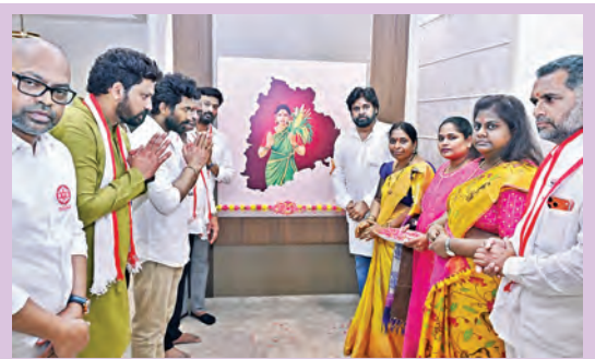
శుక్రవారం హైదరాబాద్ లో జనసేన పార్టీ కార్యాలయాన్ని ప్రారంభిస్తున్న జనసేన అధినేత పవన్ కల్యాణ్

యుఎస్ ఉపాధ్యక్షుడు జెడి వాన్స్ పర్యటన రద్దు చర్చల కొత్త తేదీ త్వరలో ప్రకటించే అవకాశం