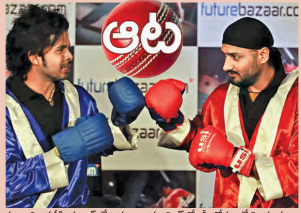
పదాలని భజ్జీకి సవాలే చేశాడు. తాను రింగ్లో నీ కోసం వేచి చూస్తుంటానని శ్రీశాంత్ తీవ్ర వ్యాఖ్యలు చేయడం హాట్ టాపిక్ గా మారింది.

ముంబై, జూన్ 19: ఐపీఎల్లో స్ట్రైక్ గేమ్ ఉదంతం జరిగి 18 మేళ్లను తున్నా చర్చారం లేదు. దమ్ముంటే బాక్సింగ్ రింగ్లో తేల్చుకుందామంటూ హర్షజనకు శ్రీశాంత్ సవాలే విసరదం మరోసారి హాట్ టాపిక్ గా మారింది. 2008 ఐపీఎల్లో శ్రీశాంత్ను హర్షజన్ చెంపవెట్టు కొట్టడం, గ్రౌండ్లోనే శ్రీశాంత్ బొటాబొటా కళ్ల నుండి నీరు కార్చడం అప్పట్లో సంచలనంగా మారింది. ఒక్క చెంపవెట్టుకు అప్పట్లో హర్షజన్ కోట్లాదినే మూల్యం చెల్లించుకోవాల్సి వచ్చింది. 18 ఏళ్ల తర్వాత ఈ వివాదం మరోసారి తీవ్ర రూపం దాల్చింది.