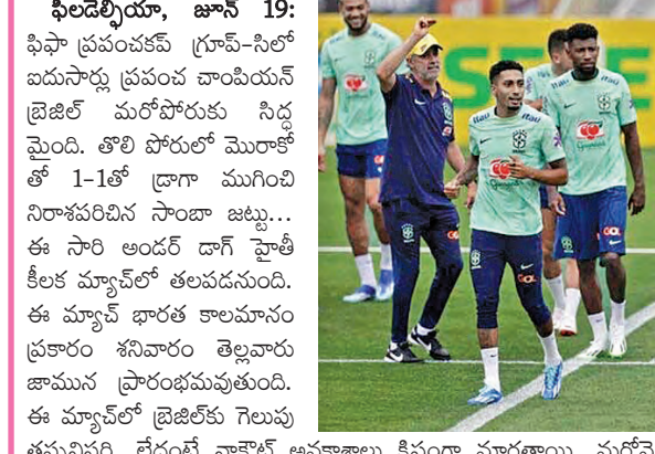
ఫిలడెల్ఫియా, జూన్ 19: ఫిఫా ప్రపంచకప్ గ్రూప్-సిలో ఐదుసార్లు ప్రపంచ చాంపియన్ బ్రెజిల్ మరోసారి సీడ్ల మైంది. తొలి పోరులో మొరొకోతో 1-1తో డ్రాగా ముగిచి నిరాశపరిచిన సాదా జట్టు...

ఈ సారి అండర్ డాగ్ ఫైట్ లీల మ్యాచ్ తలపడడం. ఈ మ్యాచ్ భారత కాలమానం ప్రకారం శనివారం తెల్లవారు జామున ప్రారంభమవుతుంది. ఈ మ్యాచ్ లో బ్రెజిల్ కు గెలుపు తప్పనిసరి. లేదంటే నాకౌట్ అవకాశాలు క్షీణంగా మారతాయి. మరోవైపు స్పాన్సర్ల వేటిలో ఓడిన ఫైట్... సంవలనం సృష్టించాలని ఆశిస్తోంది.