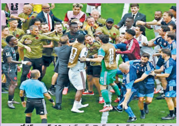
వాంకేరవ్, జూన్ 18: పుట్బాల్ గ్రౌండ్ బాక్సింగ్ రింగ్ గా మారింది. ఆటగాళ్ల ఒకరిపై ఒకరు ముష్టిపూతాలు చదిగారు. ఇది సాకర పరల్ కేసు

లో చేటుచేసుకుంది. వాంకేరవ్లో జరిగిన కేసుదా, ఖతార్ మ్యాచ్లో ఇరు జట్ల ఆటగాళ్లు తమ్ముకోసం హాట్ టాపిక్ గా మారింది. మ్యూట్ ముగియగానే కేసుదా ఆటగాళ్లు ఖతార్ జట్టుపై దూసుకొచ్చారు. ఆటగాళ్లు ఒకరిపై ఒకరు దాడి చేసుకునేందుకు యత్నించారు. ఈ క్రమంలో మైదానంలోకి వచ్చిన భద్రతా సిబ్బంది... ఇరుజట్లను వేరు చేసి అక్కడినుంచి పంపించేశారు. ఈ సమయంలో మైదానంలో గండరగోళం నెలకొంది. దీనికి సంబంధించిన పీడియో వైరల్ గా మారింది.