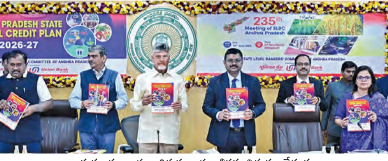
శుక్రవారం రాష్ట్ర వార్షిక రుణ ప్రణాళికను విడుదల చేస్తున్న ముఖ్యమంత్రి చంద్రబాబు. చిత్రంలో బ్యాంకర్లు, అధికారులు

విజయవాడ, జూన్ 19, ప్రభాతవార్త ప్రతినిధి: డిజిటల్ ఆర్థిక నేరాల నియంత్రణ దిశగా బ్యాంకుల చర్యలు తీసుకోవాలని ముఖ్యమంత్రి చంద్రబాబు నాయుడు బ్యాంకర్లకు దిశానిర్దేశం చేశారు. డిజిటల్ ఆర్థిక నేరాలను నిర్మూలించేందుకు ఓ ప్రత్యేక ఎన్ఫోర్స్ మెంట్ డివిజన్ ను ఏర్పాటు చేశారు. ప్రత్యేకంగా 235 రాష్ట్రస్థాయి బ్యాంకర్ల కమిటీ సమావేశానికి ముఖ్యమంత్రి హాజరయ్యారు. 2026-27 ఆర్థిక సంవత్సరానికి సంబంధించి ఆంధ్రప్రదేశ్ రాష్ట్ర వార్షిక