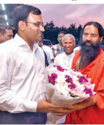
అంతర్జాతీయ యోగా కార్యక్రమంలో పాల్గొనేందుకు శుక్రవారం విమానంలో గన్నవరం విమానాశ్రయానికి చేరుకున్న రాండేవ్ బాబు వీడియోతో మాట్లాడుతూ దేశ రాజకీయాల్లో చంద్రబాబు హిమాలయ వర్షంతో అంతటి గొప్ప నాయకుడని చంద్రబాబు ప్రశంసల వర్షం కురిపించారు.

గన్నవరం, జూన్ 19 ప్రభాతవార్త: రాష్ట్ర ముఖ్యమంత్రి చంద్రబాబు నాయుడు దేశ రాజకీయాల్లో విశిష్ట నాయకుడని, ఆయన నిజాయితీ, కృషి, దూరదృష్టి దేశానికి అదర్స్ పని ప్రముఖ యోగార్థులై రాండేవ్ బాబు కోనియాడారు. ఈనెల 21వతేదీ అమరావతిలో జరిగే అంతర్జాతీయ యోగా కార్యక్రమంలో పాల్గొనేందుకు శుక్రవారం విమానంలో గన్నవరం విమానాశ్రయానికి చేరుకున్న రాండేవ్ బాబు వీడియోతో మాట్లాడుతూ దేశ రాజకీయాల్లో చంద్రబాబు హిమాలయ వర్షంతో అంతటి గొప్ప నాయకుడని చంద్రబాబు ప్రశంసల వర్షం కురిపించారు. ఆంధ్రప్రదేశ్ రాష్ట్రం పట్ల తనకు ప్రత్యేకమైన అభిమానం, ప్రేమ ఉన్నాయని తెలిపారు. ఆంధ్రప్రదేశ్ రాష్ట్రం ఆనందంగా ఉందని ఈరాష్ట్ర ప్రకృతి రిశ్యా, సంస్కృతి పరంగానూ, ఎంతో ఆశ్చర్యకరమైన కలిగిన రాష్ట్రంగా అభివర్ణించారు. యోగా ద్వారా