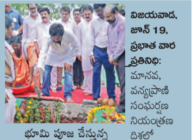
విజయవాడ, జూన్ 19, ప్రభాత వార్త ప్రతినిధి: మానవ, వన్యప్రాణి సంపదన నియంత్రణ దిశలో పీవీ

అభివృద్ధిలో భాగస్వాములవ్వాలని పెట్టుబడిదారులకు మంత్రి లోకేశ్ ఆహ్వానం విజయవాడ, జూన్ 19, ప్రభాతవార్త ప్రతినిధి: బలమైన రాష్ట్రాలో శక్తివంతమై దేశాన్ని నిర్మించగలవని, రాష్ట్రాల మధ్య ఆరోగ్యకరమైన పోటీతోనే దేశభివృద్ధి సాధ్యమని ఏపీ ఐటీ, విద్యాశాఖ మంత్రి