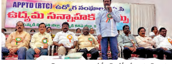
ఆర్టీసీ ప్రైవేటీకరణను అడ్డుకుంటాం: జెసి