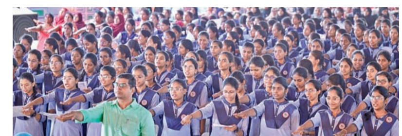
శుక్రవారం ఎలవే స్టేడియంలో జరిగిన కార్యక్రమంలో డ్రగ్స్ వ్యతిరేక ప్రతిజ్ఞ చేస్తున్న విద్యార్థులు

ప్రభుత్వ పాఠశాలల్లో 'నో అడ్మిషన్' బోర్డులు పెట్టే పరిస్థితి విద్యాభివృద్ధికి రూ. 26,600 కోట్లు ఖర్చు ఈ రంగాన్ని నేనే స్వయంగా ప్రక్షాళన చేస్తున్నా బ్లూ కాలర్ జాబ్స్ వైపు దృష్టి సారించాం యంగ్ ఇండియా వెల్ థాట్ కిట్స్ పంపిణీ, డ్రగ్స్ వ్యతిరేక ప్రతిజ్ఞలో సిఎం రేవంత్