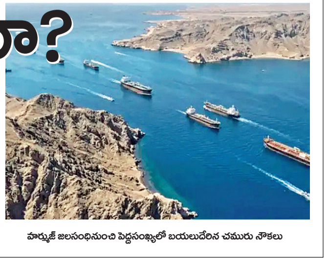
హార్డుట్ జలసంధి నుంచి పెద్దసంఖ్యలో బయలుదేరిన చమురు నౌకలు