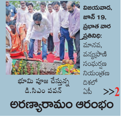
విజయవాడ, జూన్ 19, ప్రభాతవార్త ప్రతినిధి: మానవ, వన్యప్రాణి సంఘరణ నియంత్రణ దిశలో ఏపీ